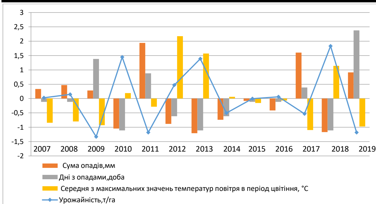
Рис. 3. Динаміка зміни показників, наведених у нормованій шкалі, де x_8 – сума опадів в період цвітіння, мм, x_9 – загальна кількість днів з опадами в період цвітіння, доба, x_{10} – середня з максимальних значень температур повітря в період цвітіння, y – урожайність вишні

Процес нормування значень проводиться для приведення різнопланових показників до єдиної шкали вимірювань за формулою: