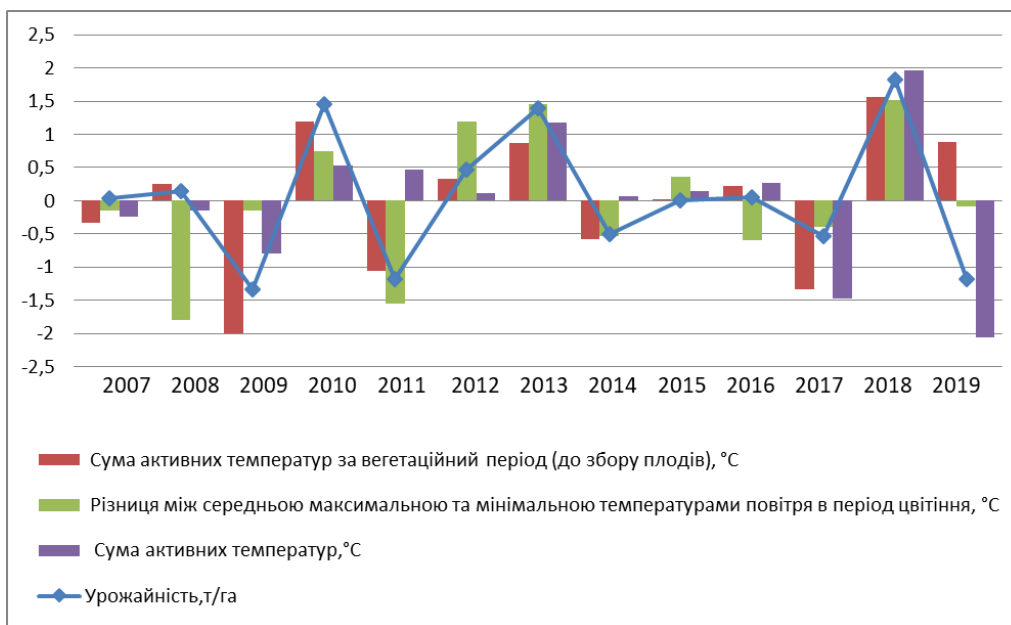
Рис. 1. Динаміка зміни показників, наведених у нормованій шкалі, де x_1 – сума активних температур за вегетаційний період (до фази досягання плодів), °C, x_2 – різниця між середньою максимальною та мінімальною температурами повітря в період цвітіння, °C, x_3 – сума активних температур у період цвітіння, °C, y – урожайність вишні

Згідно з даними рисунку 1 максимальна врожайність вишні за роки досліджень в діапазоні 9,9...11,4 т/га спостерігалася на фоні значень суми активних температур вище 10°C (САТ 10) за вегетаційний період (до фази досягання плодів); 1391,6 °C ... 1499,1 °C ( r_{YX1} = 0,77 ). Різниця між середньою максимальною та мінімальною температурами повітря впродовж 13 років становить від 10,7 °C до 18,6°C; значення r у досліджуваного гідротермічного параметру по відношенню до врожайності вишні становить r_{YX2} = 0,68 . Для забезпечення максимальної врожайності черешні на рівні 2010, 2013 та 2018 років, показник – сума активних температур вище 10°C (САТ 10) у період цвітіння, повинен мати діапазон значень 209,3–261,4 °C, тенденція підтверджується значенням r_{YX3} = 0,76 .