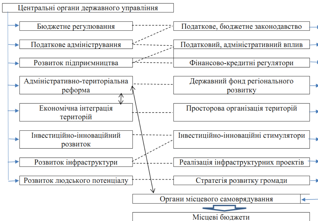
Рис. 3. Модель підвищення фінансової спроможності ОТГ