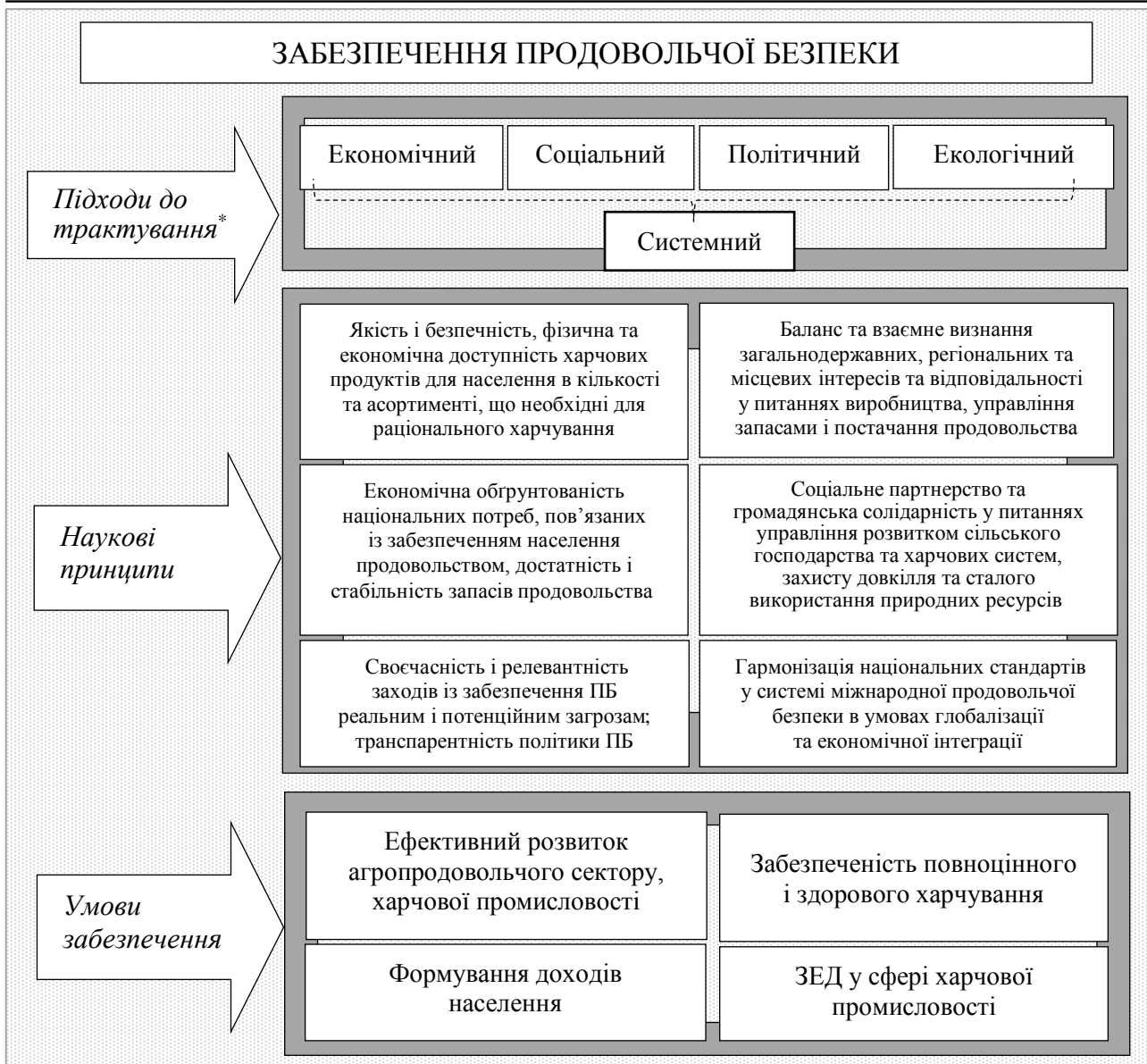
Рис. 3. Експлікація наукових підходів, принципів та умов забезпечення продовольчої безпеки

*Примітка: економічний – здатність держави до мобілізації внутрішніх ресурсів і агроекономічного потенціалу для організації виробництва с.-г. продукції та забезпечення населення продовольством переважно за рахунок власного виробництва і тим самим гарантувати економічну самостійність, тобто незалежність від зовнішніх ринків; соціальний – зайнятість населення в аграрному секторі економіки з відповідною продуктивністю праці та її оплатою; політичний – здатність держави підтримувати позитивний міжнародний імідж як конкурентної на зовнішніх ринках, забезпечувати громадянам споживання продуктів харчування відповідно до міжнародних норм; екологічний – дотримання необхідних для виробництва продуктів стандартів, що задовольняють вимоги до безпеки довкілля (Holikova, 2012; Hermanenko, 2015).