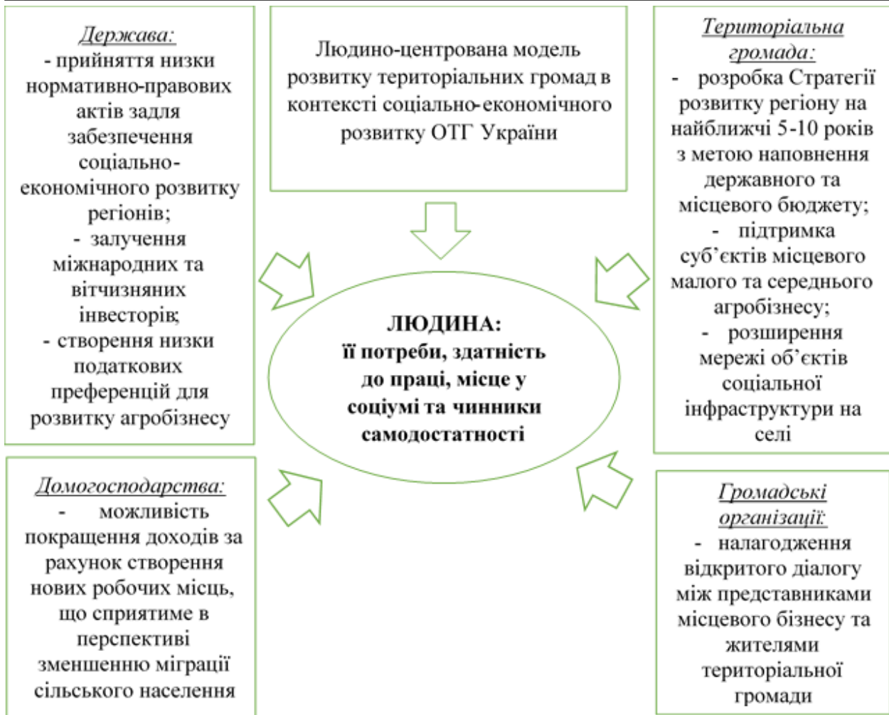
Рис. 2. Людино-центрована модель розвитку територіальних громад у контексті соціально-економічного розвитку ОТГ України