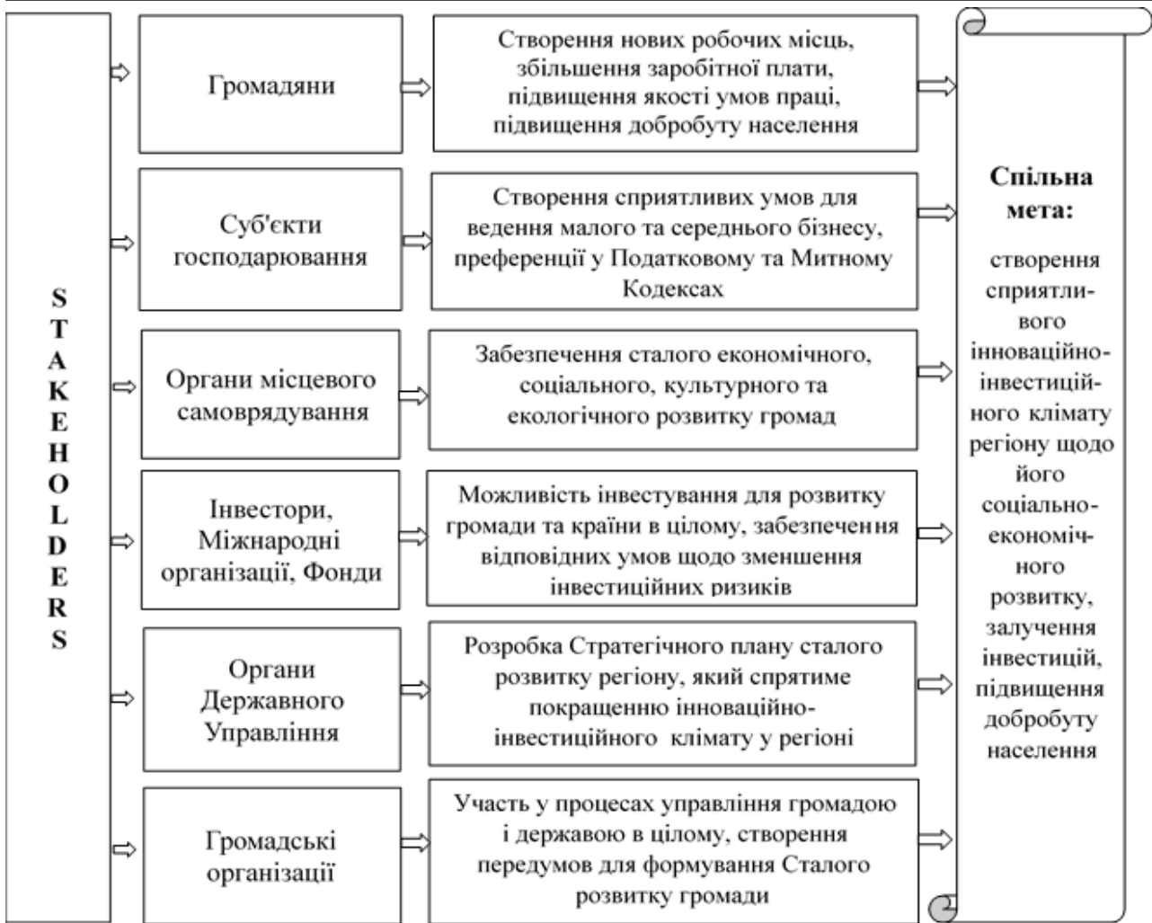
Рис. 3. Поле інтересів основних учасників (Stakeholders) процесу формування аграрно-індустріального парку в ОТГ України