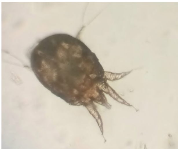
Рис. 4. Psoroptes cuniculi у зішкрібі з кірок зовнішнього слухового проходу морської свинки (оригінал) (x 150). Нативний препарат

Клінічні ознаки проявляються наявністю кірочок засохлого або воскоподібного ексудату в вушній раковині та слуховому проході. Тварини трясуть головою, чухають вуха. Вушна раковина гіперемійована, гаряча, вкрита саднами та подряпинами. Виражена кривоголовість. Згодом розвивалися осередки мокнучої екземи, а також гнійні виразки на шкірі вух.