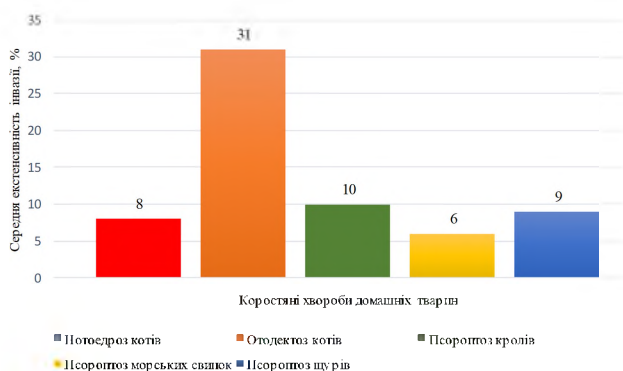
Рис. 1. Діаграма середньої екстенсивності інвазії коростяних хвороб у домашніх тварин*

*Екстенсивність інвазії розрахована при кількості сприйнятливих тварин по 100 в кожній групі