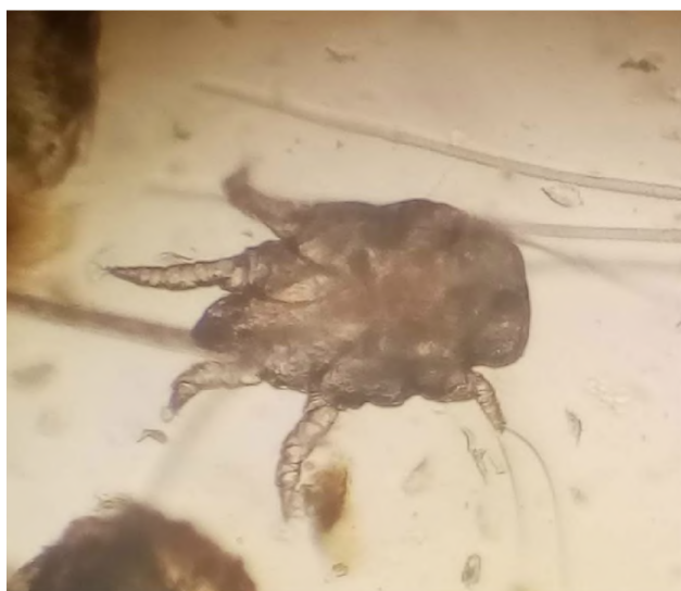
Рис. 2. Otodectes cynotis у зішкрібі з зовнішнього слухового проходу kota (оригінал) (x 150).

Збудник захворювання – кліщ-шкіроїд Otodectes cynotis Hering, 1838 (рис. 2), родина Psoroptidae Canestrini, 1892, є коменсалом зовнішнього слухового проходу котів (Sweatman, 2011; Baraka, 2011; Ismail et al., 2017).