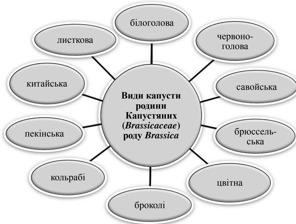
Рис. 1. Види капусти родини Капустяних ( Brassicaceae ) роду Brassica

Її цілющі властивості були відомі ще у стародавньому Римі приблизно 2000 років тому. Назва «броколі» походить від італійського « scavolo broccolo », що в перекладі означає «стеблова капуста». У XVIII столітті капуста броколі потрапила до Німеччини, а вже звідти – до України.