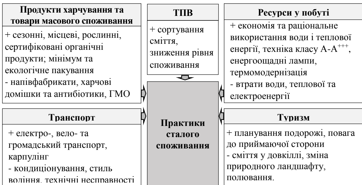
Рис. 1.1. Система практик сталого споживання

здатність обирати повсякденні моделі поведінки, що мінімально впливають на довкілля [7]. Тобто, людину можна вважати екологічно компетентною якщо у побутових звичках та у повсякденній діяльності вона застосовує практики сталого споживання у напрямках, що зазначались у пп.1.1 кваліфікаційної роботи. Узагальнюючи інформацію щодо напрямків та практичних дій і побутових звичок, нами було сформовано систему практик сталого споживання (рис. 1.1).