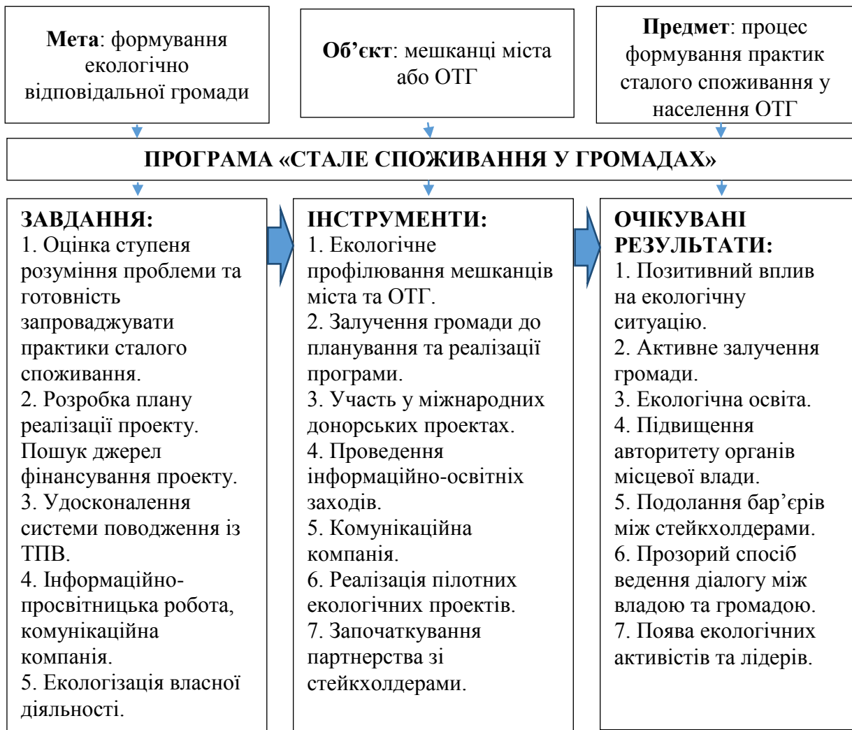
Рис. 3.1. Модель реалізації програми «Стале споживання у громадах»