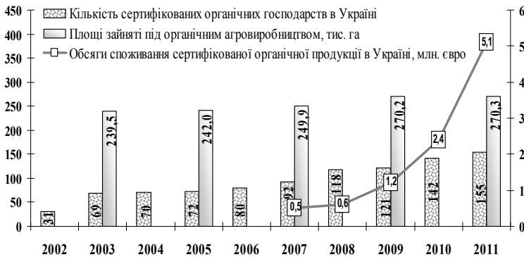
Рис. 3 Динаміка органічних сільськогосподарських площ, кількість сертифікованих органічних господарств та обсяги споживання сертифікованої органічної продукції в Україні.

Офіційні статистичні огляди IFOAM підтверджують, привабливість даного сектора агровиробництва в Україні. Якщо на початок 2003р. в Україні було зареєстровано 31 господарство, що отримало статус “органічного”, то наприкінці 2011р. нараховувалось вже 155 сертифікованих органічних господарств, а загальна площа сертифікованих органічних сільськогосподарських земель складала більше 270 тис. га, (рис. 3) [1].