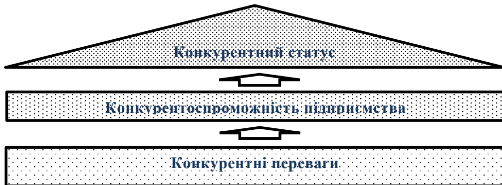
Рис. 1.1. Трияда конкурентного статусу підприємства

Такий підхід уможливорює визначити місце конкурентного статусу у підвищенні конкурентоспроможності підприємства (рис. 1.1.).