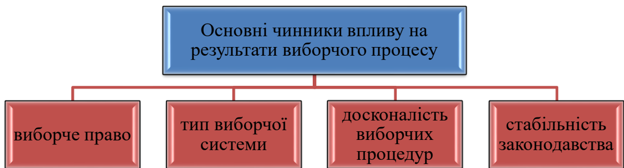
Рис. 1.1. Основні чинники впливу на результати виборчого процесу

Зважаючи на історичну складову та вищезазначені підходи дослідження виборчого процесу вважаємо, що основними чинниками впливу на результати виборчого процесу є: виборче право, тип виборчої системи, досконалість виборчих процедур та стабільність законодавства (рис. 1.1).