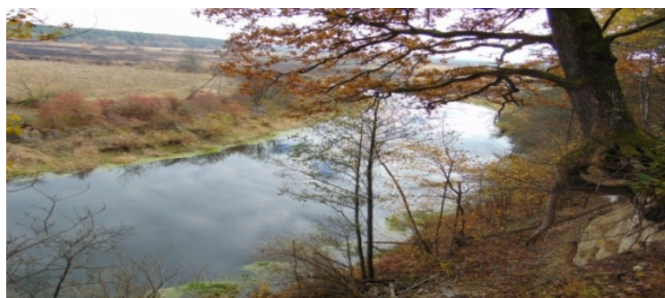
Рис. 6. Пам'ятка природи (комплексна) Горинські Крутосхили

Пам'ятка природи (комплексна) Горинські Крутосхили, розміщена в межах Ківерцівського району Волинської області, на схід від села Яківці й на південь від села Деражне (рис. 6). Площа – 30 га. Статус пам'ятки природи Горинські Крутосхили отримали в 1975 р.