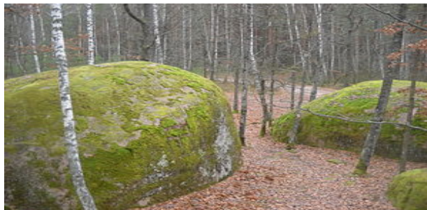
Рис. 1. Заказник геологічний місцевого значення Камінне Село

площу 2 га. На березі Київського водосховища у стіні кар'єру та в яру, що перетинає село, оголюються відклади неогенового та палеогенового віку (рис. 2). Найпотужніший шар становить 50–60 м. Об'єкт має серію різноманітних порід, окрасою яких є пісковик (потужністю 2,5–3 м). Він містить скам'янілі ядра прісноводних пелеципод.