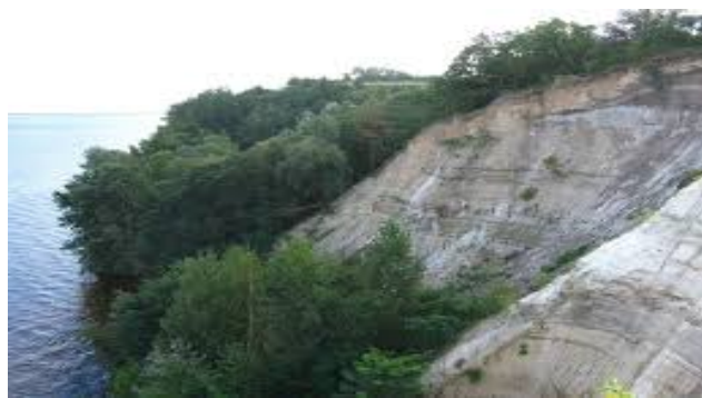
Рис. 2. Пам'ятка природи геологічна місцевого значення Ново-Петрівський геологічний розріз

Заказник геологічний місцевого значення Корецькі граніти, розміщений у межах Корецького району Рівненської області, між селом Новий Корець та містом Корець (рис. 3). Його площа – 15 га. Заказник створений із метою збереження гранітних скель на березі річки Корчик. Граніт темно-сірий, складається з кварцу, польового шпату, біотиту, а також тонких прожилок графіту.