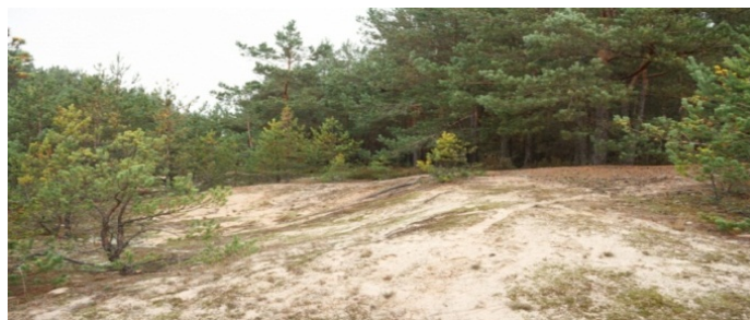
Рис. 5. Заказник геологічний місцевого значення Дюна

Заказник геологічний місцевого значення Дюна розміщений на території Старовижівського району Волинської області, між селами Синове, Буцинь та Сереховичі (біля села Нова Воля) (рис. 5). Площа – 90,1 га. Дюна утворена на Волинському Поліссі в умовах післяльодовикової пустелі в результаті перевіювання з наступною акумуляцією водно-льодовикових середньоплейстоценових пісків зандрової рівнини після дніпровського зледеніння – еолова параболічна дюна.