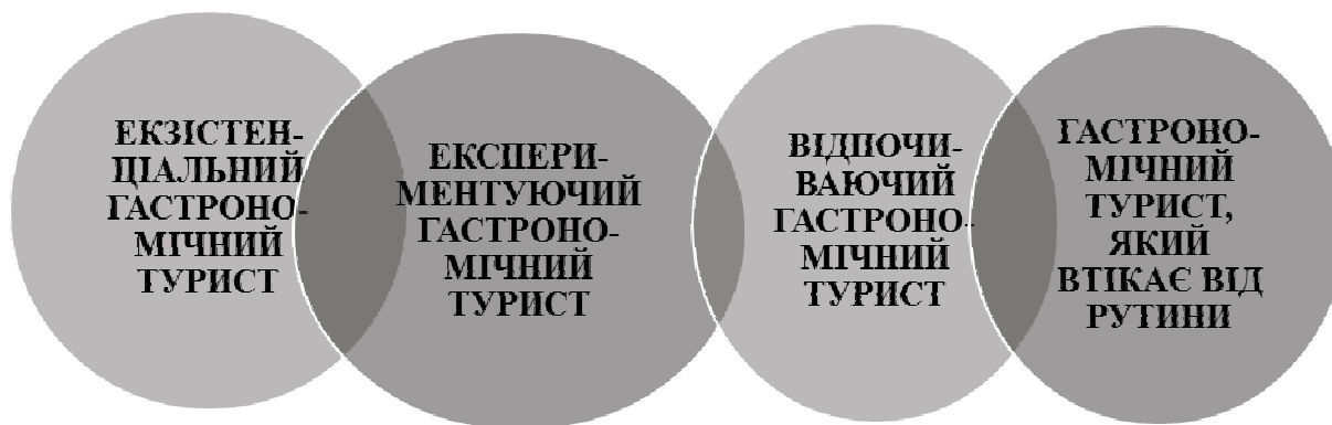
Рис. 4. Типи гастрономічних туристів [11, с. 357]

Відповідна класифікація дозволяє отримати цілісну картину уподобань туристів відносно споживання їжі під час мандрівки і є корисною для сегментації цільової аудиторії підприємств гастрономічної сфери.