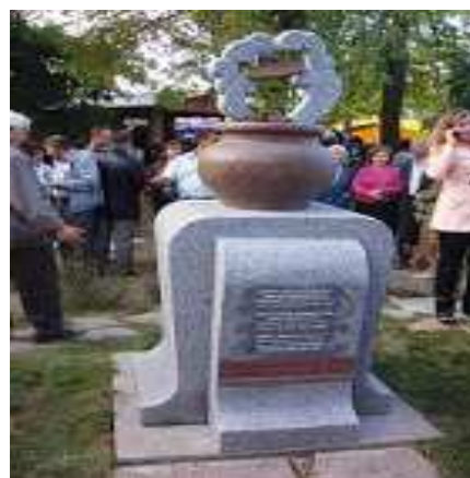
Рис. 3. Скульптурна композиція «Дерун» відкрита 19 вересня 2009 року

Головна мета фестивалю гастрономічна – зберегти автентичні традиції поліської національної кухні. Святкують цей Фестиваль з 2008 року і донині. В меню фестивалю: тради-