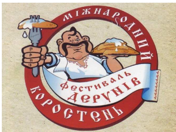
Рис. 2. Логотип гастрономічного фестивалю «Дерунів»

Фестиваль деруна – щорічний фестиваль у Коростені, присвячений дерунам. Проходить у другу суботу вересня в міському Древлянському парку. Головне змагання гастрономічної події – кулінарний конкурс на найсмачніші деруни. Визначає переможця журі. За символічну суму кожен може придбати патент дегустатора і таким чином стати членом журі.