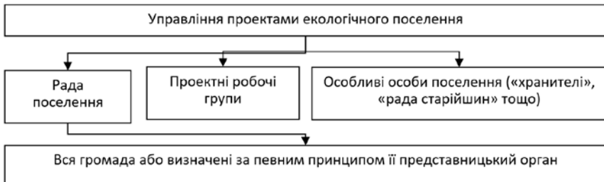
Рис. 2. Узагальнююча схема використання проектного підходу в екологічному поселенні

Сформована на основі визначеної мети робоча структура проекту структурує роботи, що потрібно виконати для реалізації визначених проектів у поселенні. Структурування учасників проектів в екологічних поселеннях дозволяє виокремити їх групи за рівнем долученості до проекту та відповідальності за його наслідки (рис. 2).