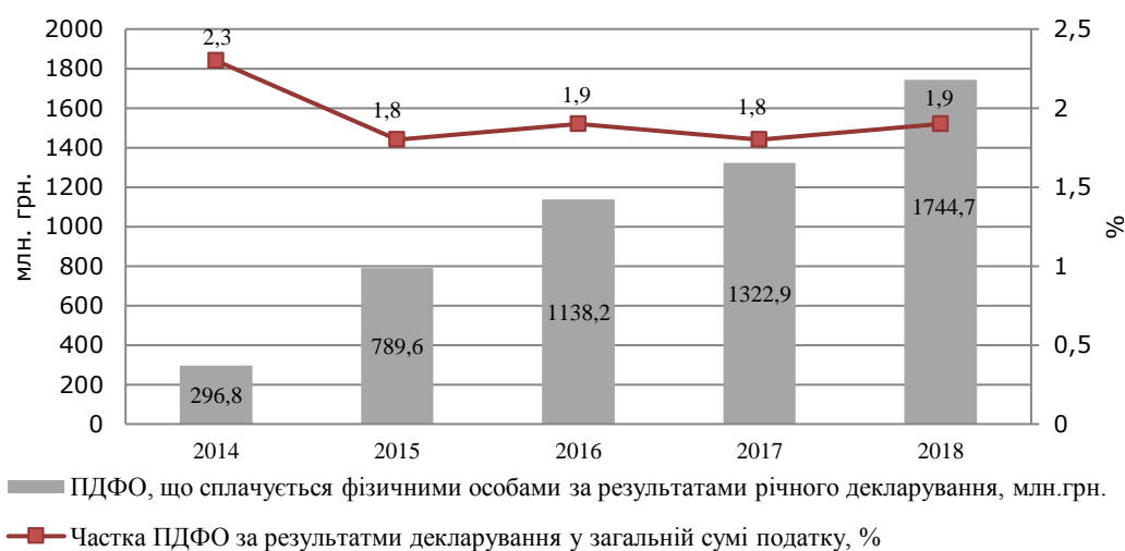
Рис. 2. Динаміка ПДФО за результатами річного декларування