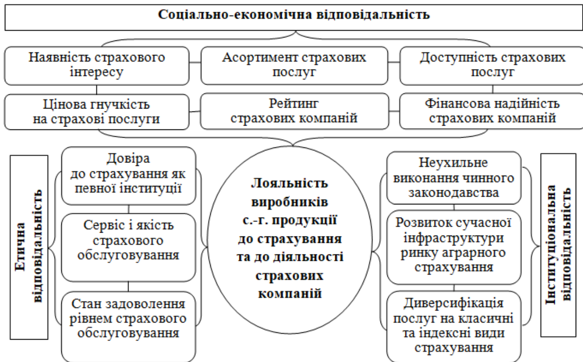
Рис. 3. Фактори, що сприяють підвищенню лояльності страховальників у системі координат соціальної відповідальності страховиків

основні фактори можливої лояльності страховальників, згрупуємо їх за трьома ознаками (рис. 3).