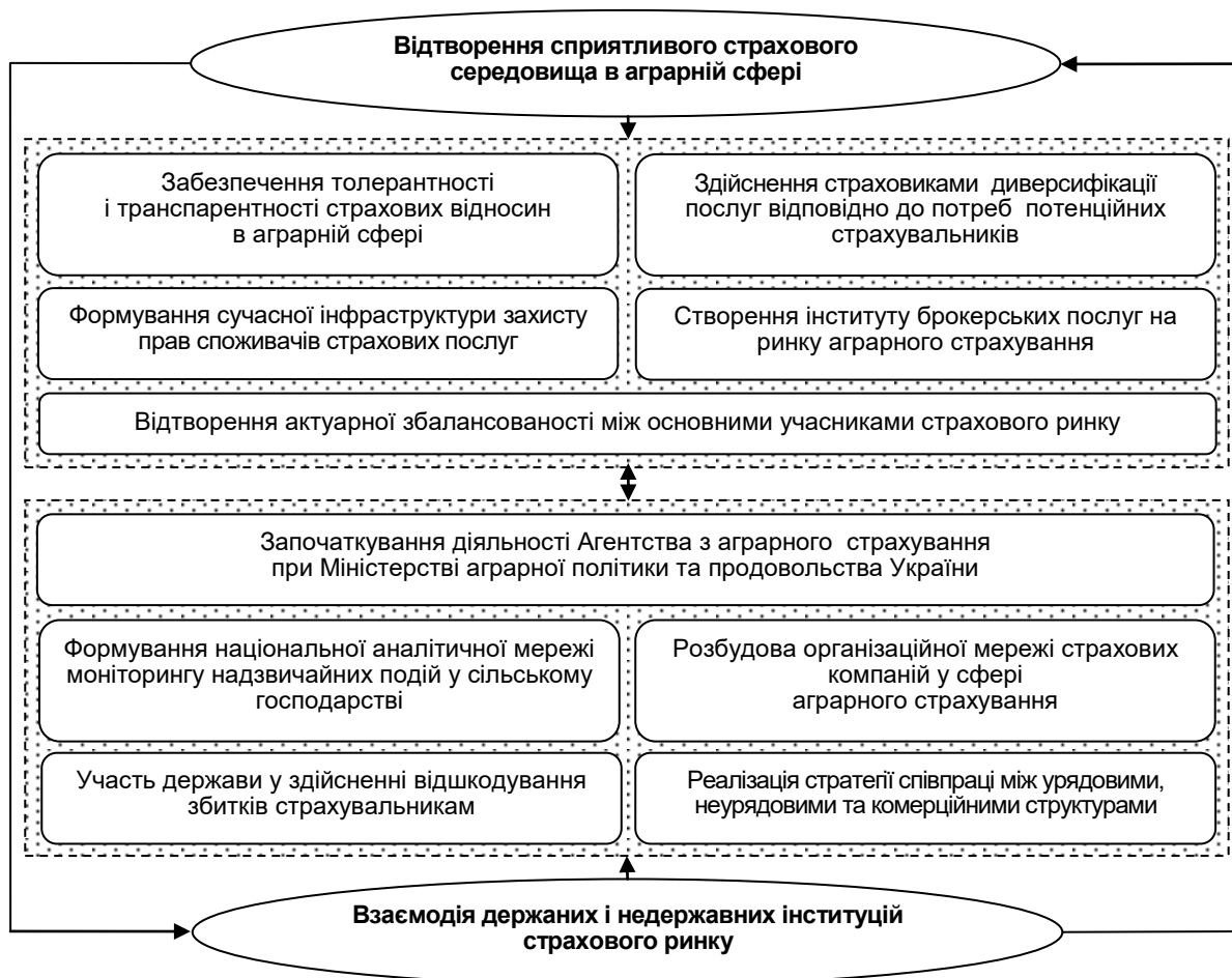
Рис. 1. Стратегічні орієнтири інституціональної модернізації ринку аграрного страхування

Стратегічні орієнтири інституціональної модернізації страхового ринку передбачають виокремлення двох груп взаємопов'язаних заходів (відтворення сприятливого страхового середовища в аграрній сфері та взаємодію держаних і недержавних інституцій), спрямованих на досягнення поступової реалізації існуючого потенціалу розвитку ринку аграрного страхування (рис. 1).