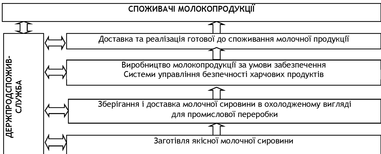
Рис. 1. Виробничий цикл для молокопродукції відповідно до НАССР

робкою документації та наведенням елементарного порядку на виробництві. Важливо, щоб усі учасники виробничого процесу - від закупівлі молочної сировини до кінцевого споживача були свідомі, діяли прозоро і відповідально. Контроль за виконанням даних міжнародних стандартів якості покладено на Держпродспоживслужбу, яка відтепер контролює ветеринарні та фітосанітарні заходи у регіонах держави, є своєрідним містком для підтримання інтересів споживачів і виробників, перевіряє дотримання санітарно-епідеміологічних норм на виробництві та ціни на готову молокопродукцію [7]. Кожний учасник ринку, в тому числі і споживачі, відповідно до нових законодавчих актів, з цього моменту мають право вимагати від Держпродспоживслужби здійснення перевірки діяльності іншого учасника (оператора) ринку, проведення лабораторно-клінічних досліджень його продукції відповідно до нормативів сертифіката. У свою чергу молочні підприємства несуть відповідальність за виготовлення якісної та безпечної для здоров'я нації молокопродукції на всіх етапах виробничого циклу: заготівля молочної сировини - зберігання і доставка сировини в охолодженому вигляді на місце промислової переробки - виробництво молокопродукції - доставка і реалізація готової до споживання молочної продукції - споживач (рис. 1).