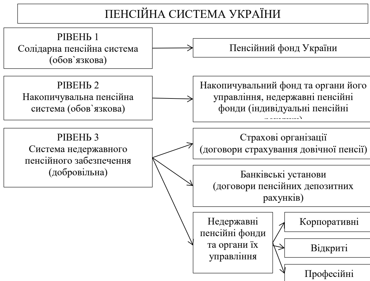
Рис. 1.1. Структура системи пенсійного забезпечення України

Третій рівень – система недержавного пенсійного забезпечення, що базується на засадах добровільної участі громадян, роботодавців та їх об'єднань у формуванні пенсійних накопичень з метою отримання громадянами пенсійних виплат на умовах та в порядку, передбачених законодавством про недержавне пенсійне забезпечення [23].