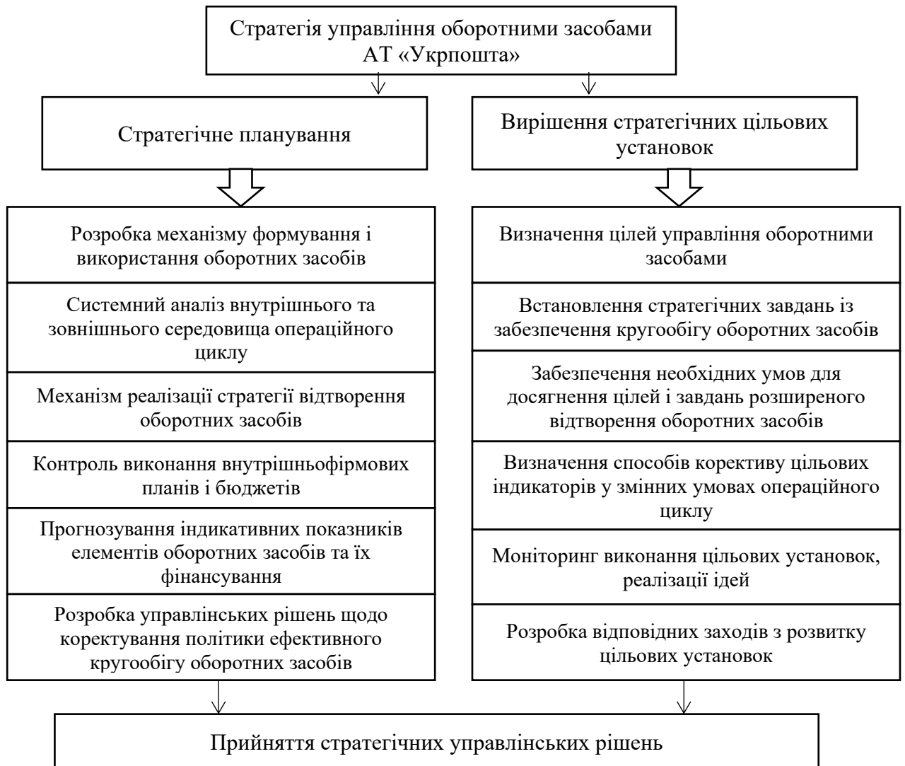
Рис. 3.3. Стратегія управління оборотними засобами АТ «Укрпошта»

На сучасному етапі економічного розвитку можна виокремити 2 напрямки стратегічного управління оборотними засобами АТ «Укрпошта»: стратегічне планування й вирішення цільових установок (рис. 3.3).