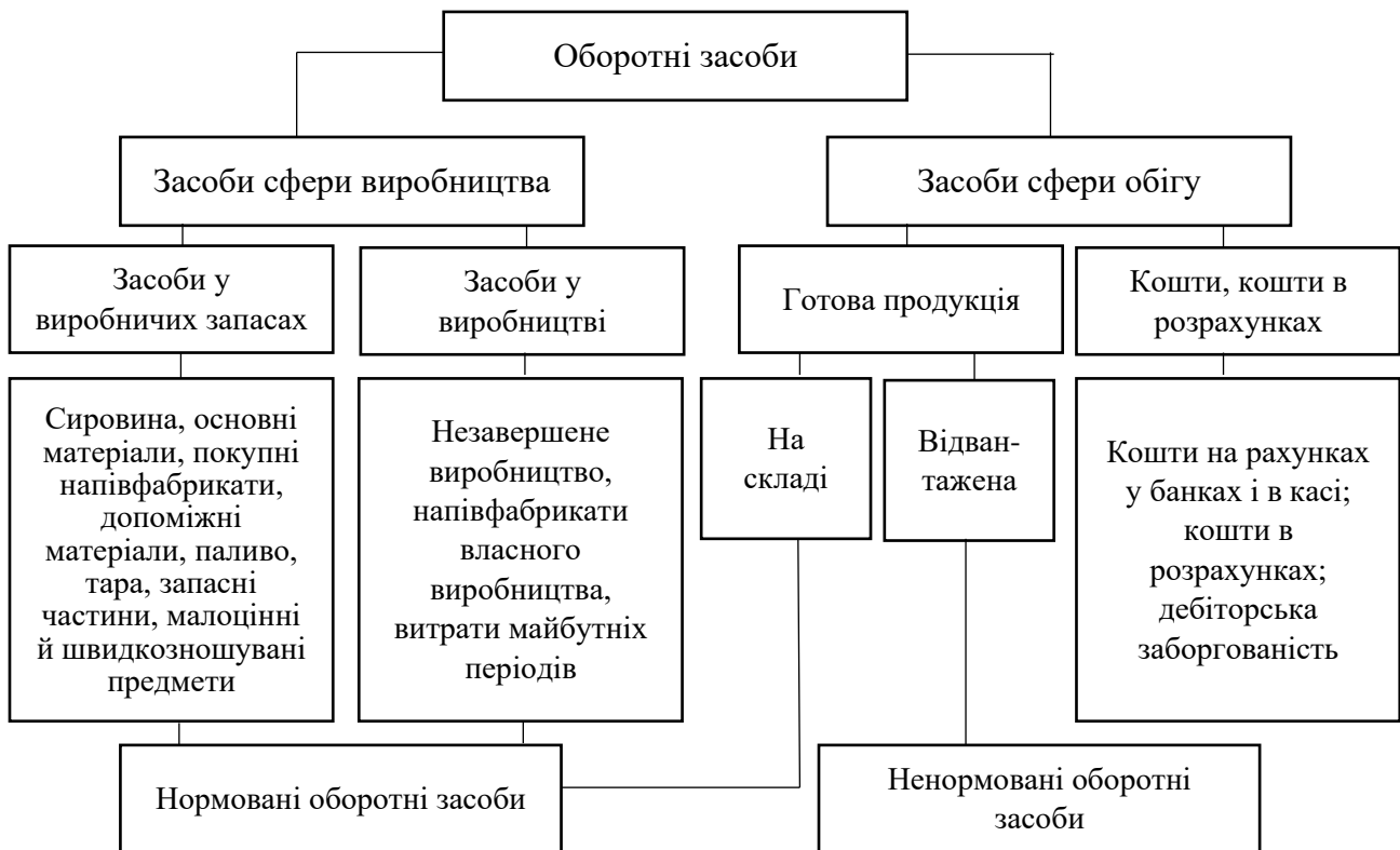
Рис. 1.1. Складові елементи оборотних засобів підприємства

належать витрати на виконання науково-дослідних та раціоналізаторських робіт, освоєння нової техніки, орендну плату та інші, що проводяться в поточному році, але на собівартість продукції зараховуватимуться в наступному періоді [36]; 4) залишки готової продукції на складах, до якої належить продукція, яка знаходиться на складах на кінець розрахункового періоду, однак не оплачена замовником [36].