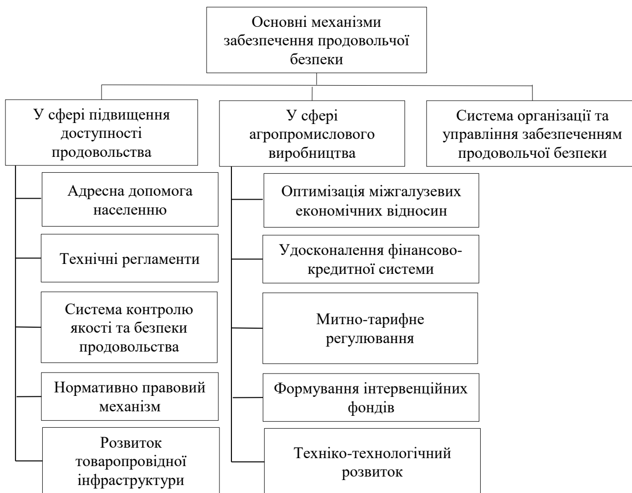
Рис. 1.1. Механізми забезпечення продовольчої безпеки