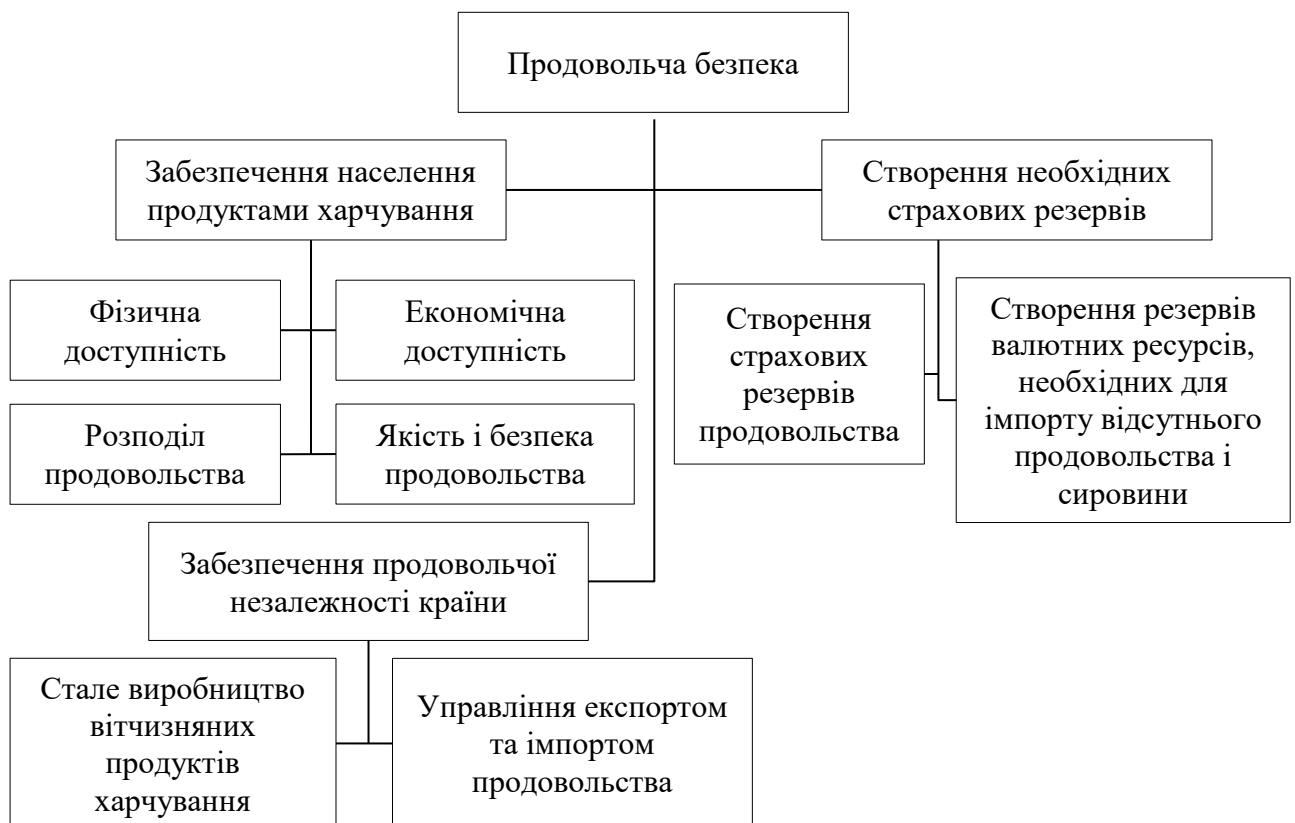
Рис. 1.3. Критерії продовольчої безпеки країни

Його суть полягає в тому, щоб держава могла задовольнити потребу населення в продуктах харчування незалежно від впливу зовнішніх і внутрішніх факторів (рис. 1.3). Крім цього їх кількість і якість має бути достатньо для нормального фізичного і соціального розвитку людини.