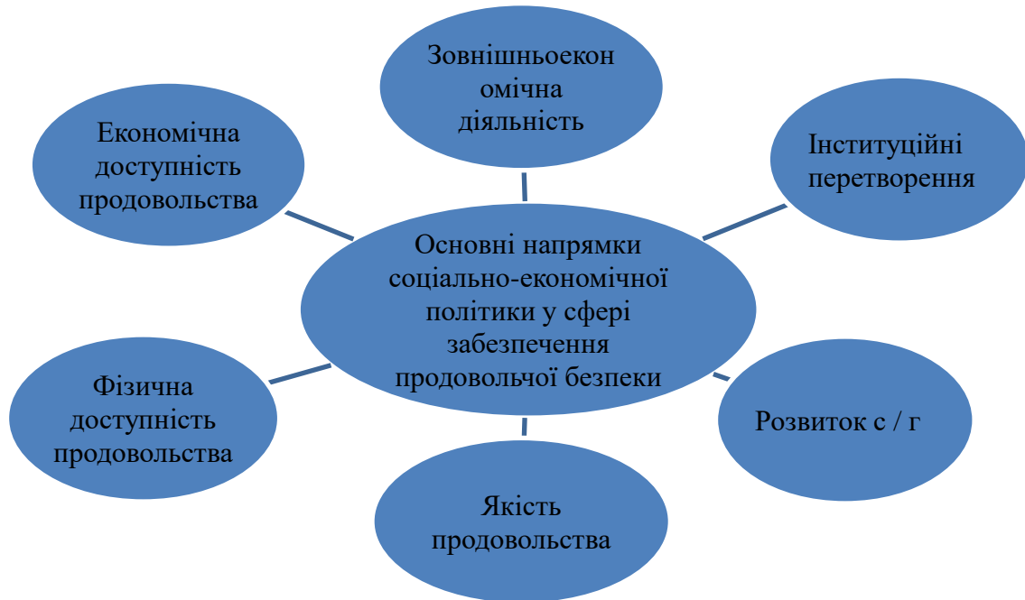
Рис. 1.2. Основні напрямки соціально-економічної політики у сфері забезпечення продовольчої безпеки

використовує у своєму виробництві вітчизняну сировину і матеріально-технічну базу з мінімізації зовнішніх ризиків. Виходячи з положень чинного законодавства України, доцільно визначати продовольчу безпеку держави як компонент економічної безпеки на макрорівні країни.