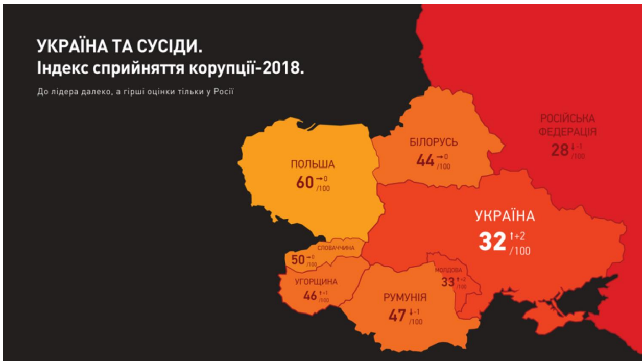
Рис.3.1.Україна в індексі сприйняття корупції.[11]

Публічна сфера України, у зв'язку з рядом суб'єктивних та об'єктивних довготривалих чинників, без сумніву може бути віднесена до даної групи країн, в яких корупція стала найактуальнішою небезпекою на національному та локальних рівнях, проблемою політичного, економічного та соціального розвитку суспільства (Рис.3.1) . Світовий досвід показує, що перехід до постіндустріального суспільства може сформувати нові інноваційні моделі антикорупційної політики, які можуть бути застосовані і в Україні.