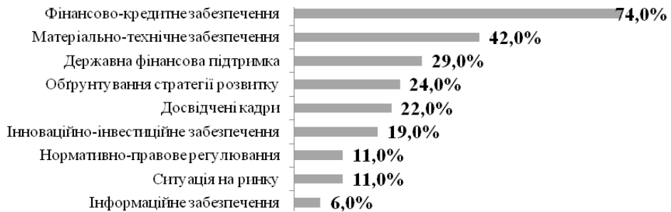
Рис. 3. Основні чинники розвитку диверсифікації на сільськогосподарських підприємствах (за результатами соціологічного опитування)

Ефективність проведення диверсифікації та сільськогосподарському підприємстві, безперечно, залежить від якості внутрішнього управління, здійснюване його керівництвом. Разом з тим, розглядаючи підприємство як відкриту систему, що тісно взаємодіє зі зовнішнім середовищем, не можна не відмітити вагому роль макросередовища у сприянні розвитку диверсифікації сільськогосподарських підприємств. Результатами соціологічного опитування керівників 100 сільськогосподарських підприємств Житомирської області дали змогу обґрунтувати основні чинники, що сприятимуть розвитку диверсифікації на сільськогосподарських підприємствах (рис. 3)