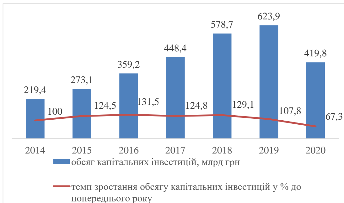
Рис. 2.1. Динаміка обсягу капітальних інвестицій в економіку України, млрд. грн.

Капітальні інвестиції відіграють важливу роль у процесах відтворення та забезпечення довгострокового соціально-економічного розвитку країни. В Україні протягом останніх років спостерігалася динаміка до зростання обсягів капітальних інвестицій (рис. 2.1.).