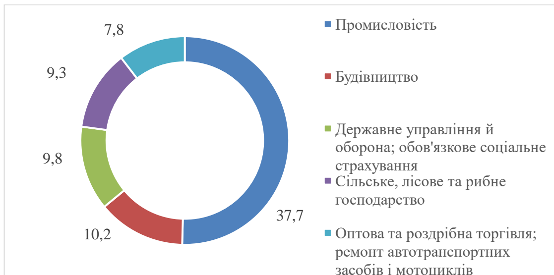
Рис. 2.2. Обсяги та структура капітальних інвестицій підприємствами України за сферами економічної діяльності у січні-вересні 2021 р.

Структуру обсягів освоєння капітальних інвестицій підприємствами України у січні-вересні 2021 р. за сферами економічної діяльності можна побачити на рис. 2.2.