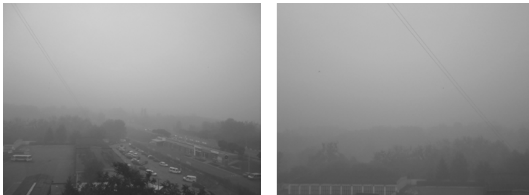
Рис. 1. Задимленість Богунського р-ну м. Житомир унаслідок горіння торфовищ у Житомирській області (04.09.2015 р.,)

пожежі рухаються повільно, по декілька метрів на добу. Причому торф може горіти в усіх напрямках, незалежно від напрямку й сили вітру, а під ґрунтом він горить навіть під час помірного дощу й снігопаду. Вони небезпечні раптовими проривами вогню з-під землі й тим, що їхній край не завжди помітний. Температура всередині товщі торфу, охопленого пожежею, досягає понад сотень градусів.