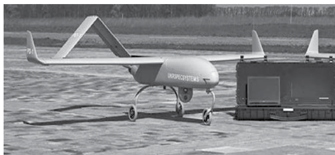
Рис. 2. Безпілотні літальні апарати «Фурія» (а) та «Spectator» (б)