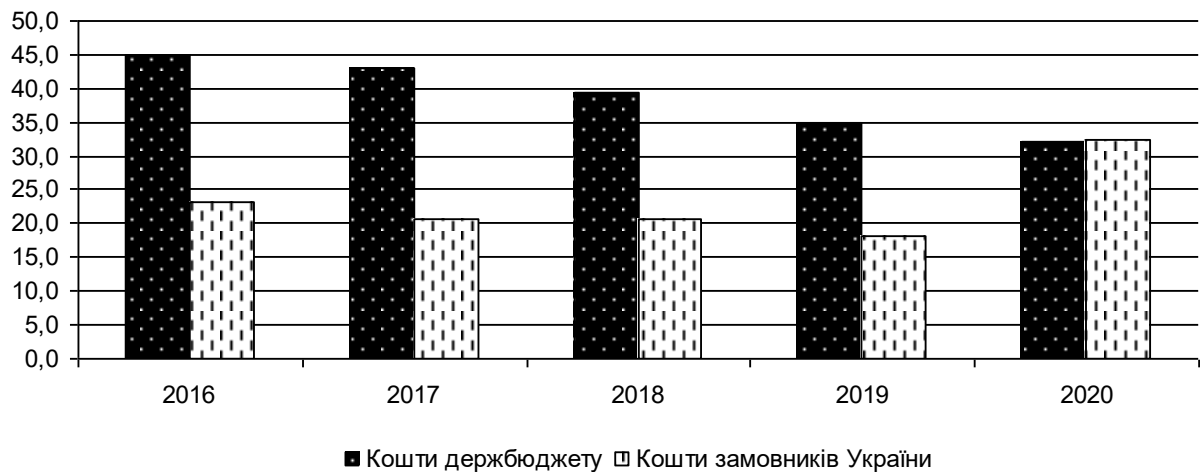
Рис. 3.2. Індекс сприйняття корупції України протягом 2016–2020 років, %