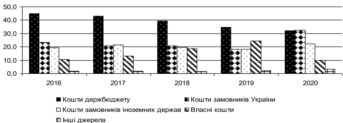
Рис. 2.2. Фінансування наукової та науково-технічної діяльності, %[12]

Фінансування наукової та науково-технічної діяльності в Україні яке відображене на рис. 2.2., показує динаміку фінансування науки з державного бюджету порівняно з 2016 р. зменшилося на 12,8%. Намітилась тенденція збільшення фінансування іноземними структурами, та коштами вітчизняних інститутів [13].