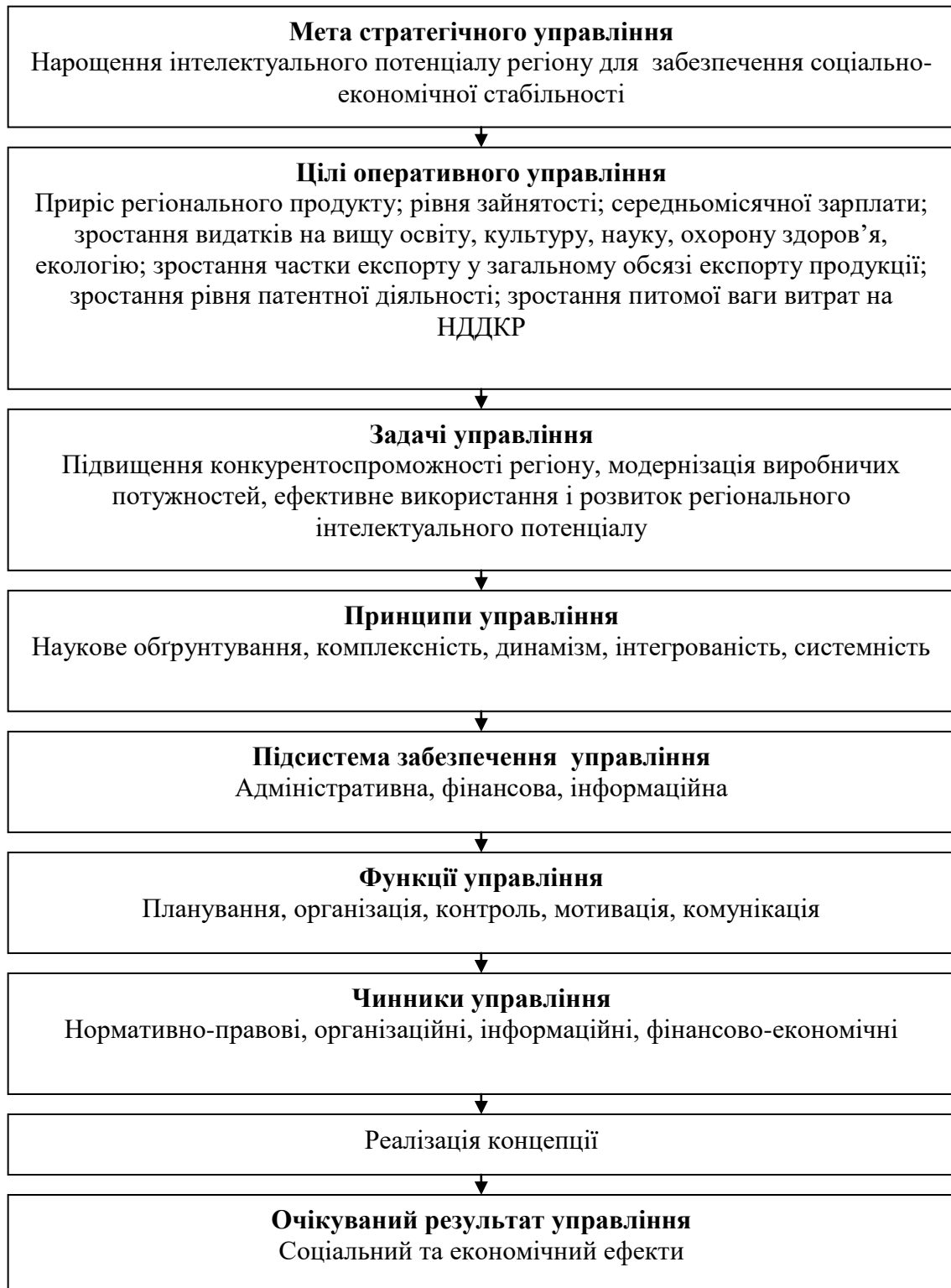
Рис. 3.1. Стратегія управління інтелектуальним потенціалом економіки України[9]

В сучасних умовах потрібна цілісна концепція вдосконалення механізмів державної політики розвитку інтелектуального потенціалу