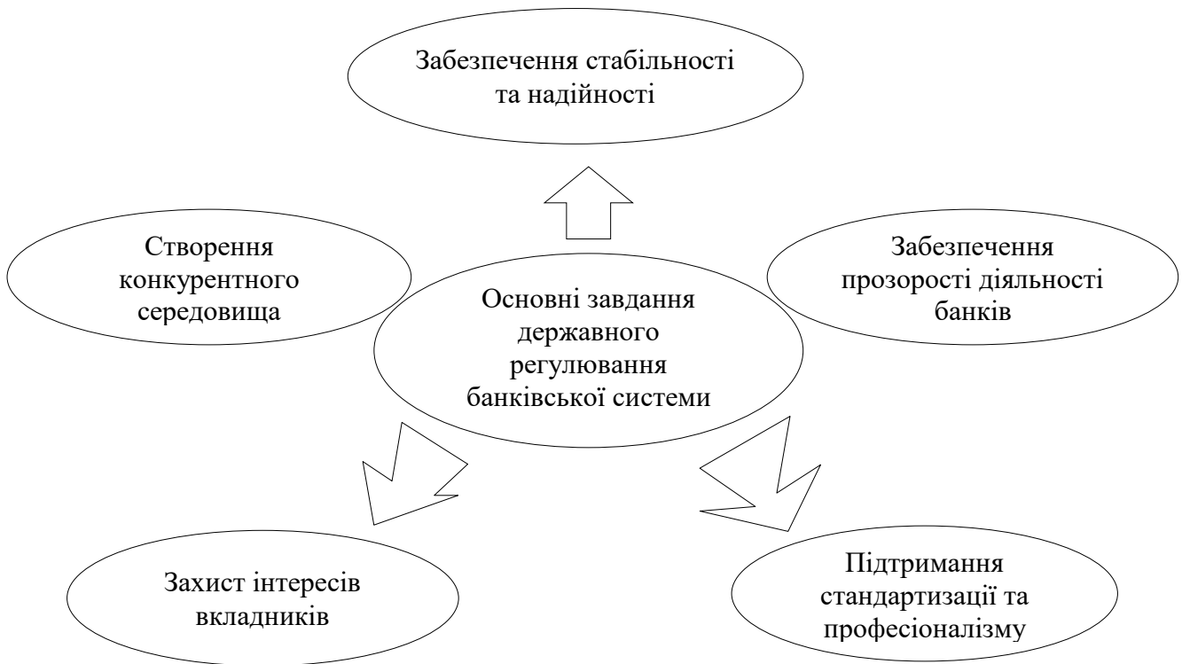
Рис.3.1. Основні завдання державного регулювання банківської системи

Правова інфраструктура банківського нагляду визначає право наглядового органу на отримання від банків офіційної звітності й іншої інформації необхідної в процесі нагляду, а також право проведення перевірок на місці.