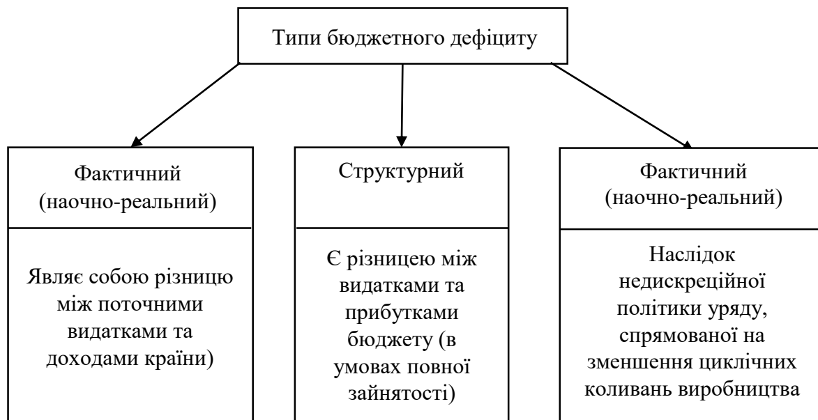
Рис.1.2. Типи бюджетного дефіциту

Відповідно до нововведень у фіскальній політиці, існують наступні типи бюджетного дефіциту (Рис.1.2).