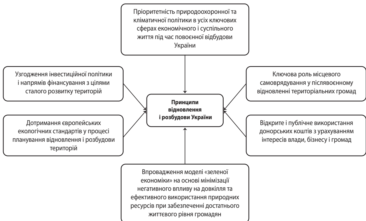
Рис. 3. Основні засади відновлення і відбудови України

Під час відбудови України необхідно раціонально поєднати процеси швидкого відновлення об'єктів критичної інфраструктури з новими підходами до капітального будівництва тих об'єктів, які матимуть довгострокову ефективність і забезпечать стаке майбутнє для наступних поколінь.