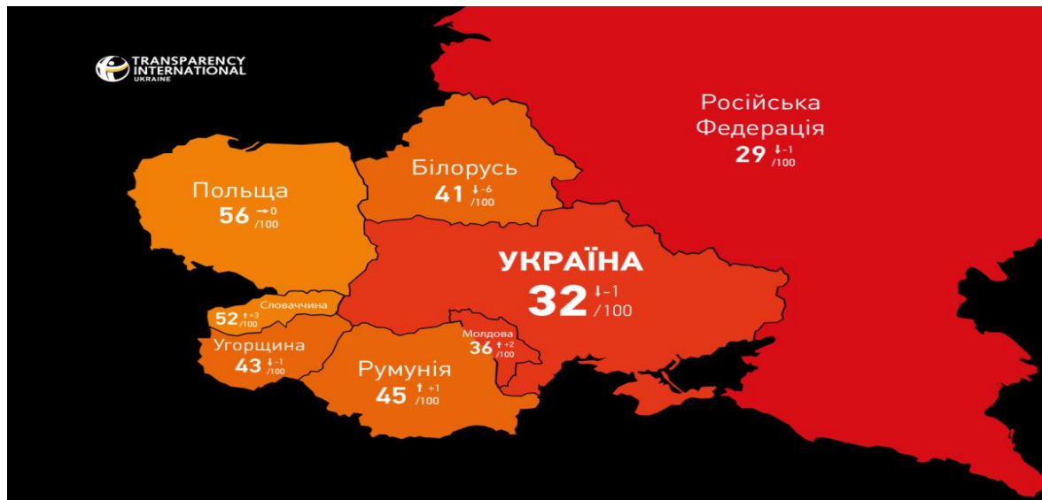
Рис. 2.1. Індекс сприйняття корупції у 2021 році [22]

покращились показники Словаччини — 52 бали (+3, 56 місце), Румунії — 45 балів (+1, 66 місце) та Молдові — 36 балів (+2, 105 місце) [22].