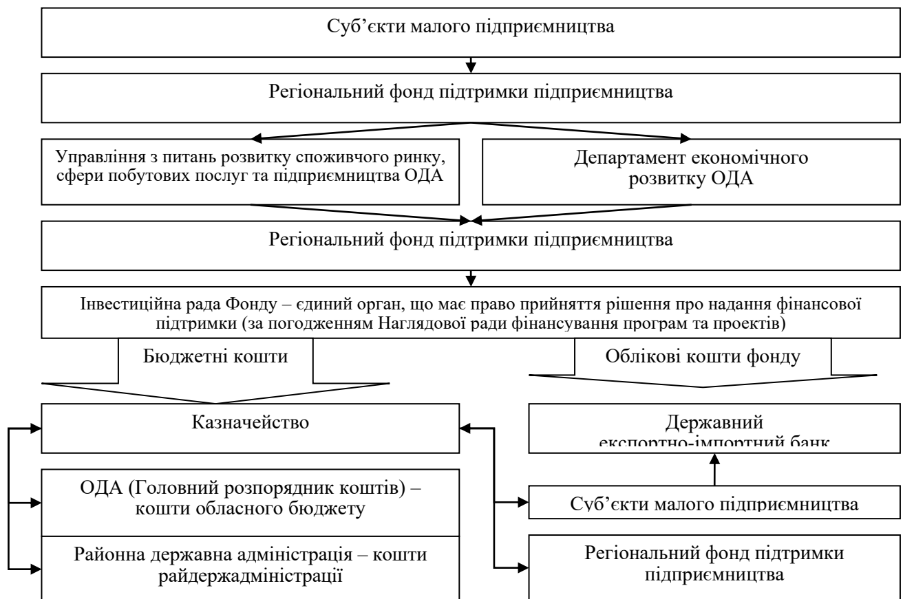
Рис. 3.1. Організаційно-економічний механізм реалізації державної фінансової підтримки через механізм Регіонального фонду підтримки

Серед заходів механізму держпідтримки МП в Україні виділяють: часткову компенсацію факторингових, лізингових, платежів та платежів за користування гарантіями, компенсацію видатків на розвиток кооперації, позики на придбання і впровадження нових технологій, фінансову підтримку впровадження екологічно чистих технологій, енергозберігаючих та цільове бюджетне фінансування, пільгове та мікрокредитування, створення державних, регіональних і місцевих інформаційних систем, проведення тренінгів, поширення, комунікаційних мереж, сприяння підприємницької діяльності за допомогою Інтернету, поширення друкованої та електронної літератури, вдосконалення нормативної бази з метою створення сприятливих умов функціонування малого підприємництва, пільгове кредитування, податкові пільги, оцінка результативності заходів (додаток Б). Велика роль відводиться Регіональному фонду підтримки підприємництва (рис. 3.1).