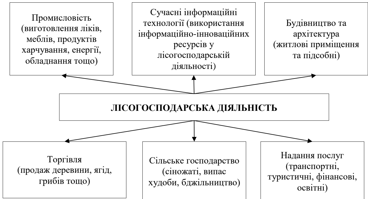
Рис. 1.1 Взаємозв'язки лісогосподарської діяльності з секторами економіки

«Ліси є важливою частиною національного багатства держави і регіонів. Вони являються джерелом сировини, що сприяє розвитку економіки та забезпечують покращенню екологічної ситуації, що в свою чергу поліпшує стан здоров'я населення. У цій галузі є продукти переробки, які дуже цінні. Та от, для задоволення потреб людини (лікування та харчування) або забезпечують виробничі процеси (виробляються продукти харчування, ліків тощо). Лісогосподарська діяльність відноситься до первинного сектору економіки, але на даному етапі воно тісно пов'язане з вторинним, третинним і четвертинним секторами (рис.1.1)» [51].