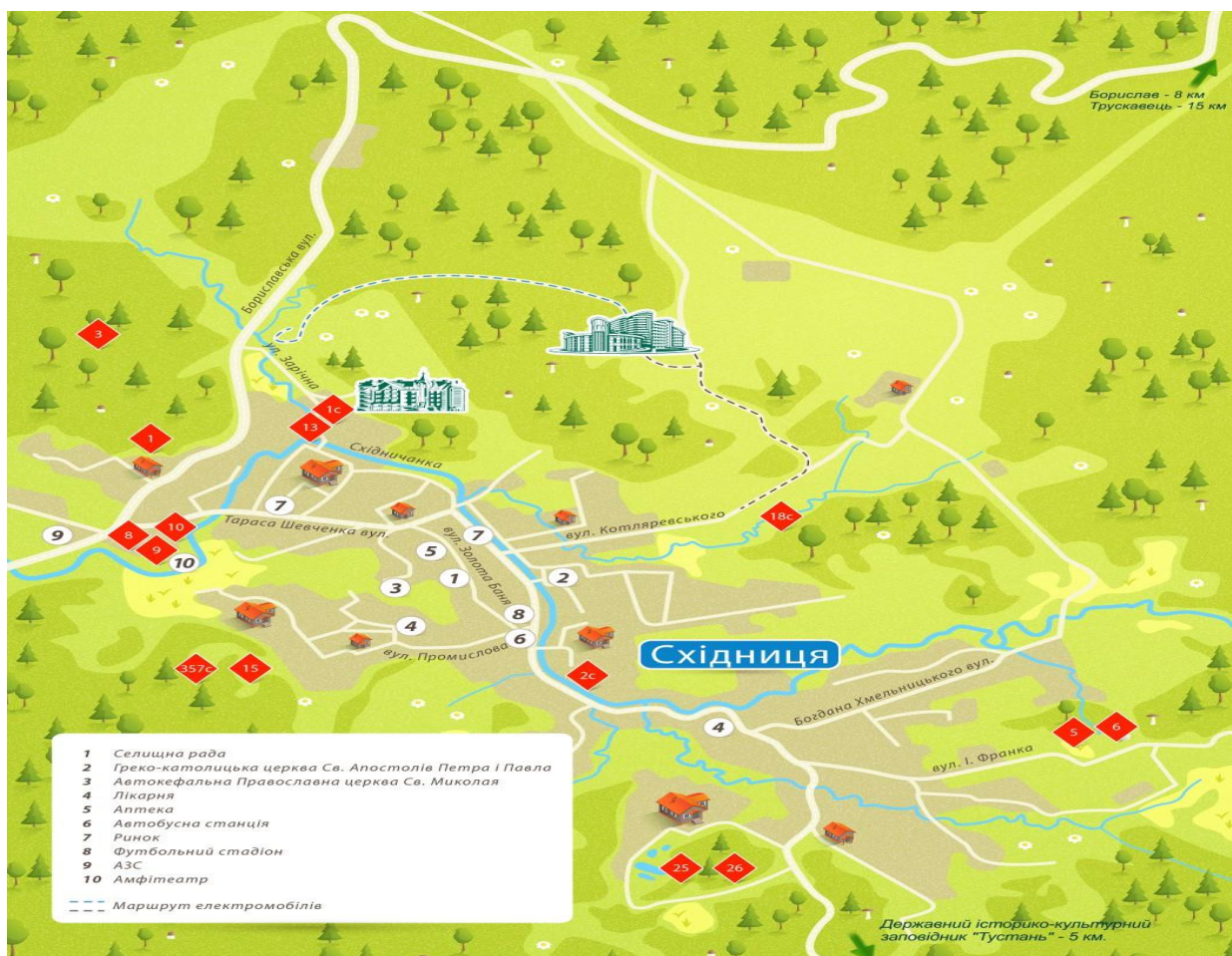
Рис. 2.1 Карта бальнеологічного курорту Східниця.