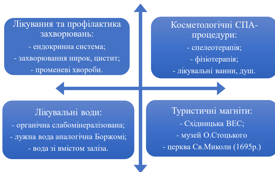
Рис. 2.2. Структурні елементи інноваційного туристичного продукту бальнеологічно-рекреаційного спрямування