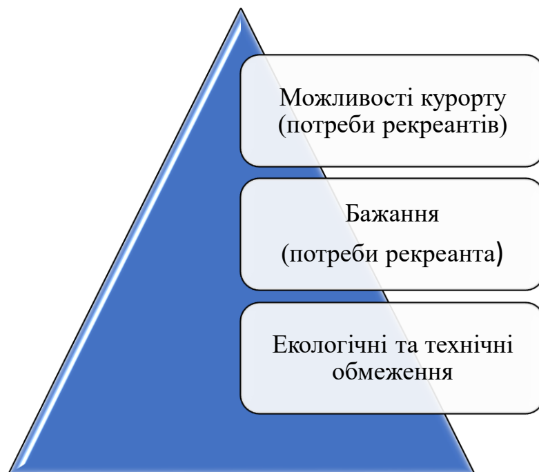
Рис.3.1. Вихідні умови реалізації стратегічних напрямків розвитку бальнео-рекреаційних курортів.

Також варто взяти до уваги, що реалізація стратегічного напрямку розвитку бальнео-рекреаційних курортів залежить від вихідних умов, що сформувались у трикутнику (рис.3.1).