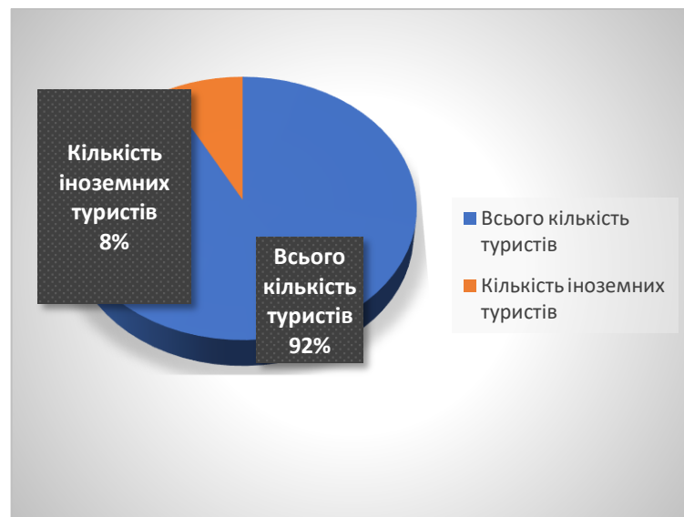
Рис 2.3. Кількість туристів станом на 2018 рік в санаторно-курортному комплексі Великий Любінь

- дотримання пацієнтом рекомендацій лікаря та проведених процедур. Пацієнтам важливо усвідомлювати та розуміти, що вони повинні дотримуватись рекомендацій і виконувати процедури для отримання максимальної користі.