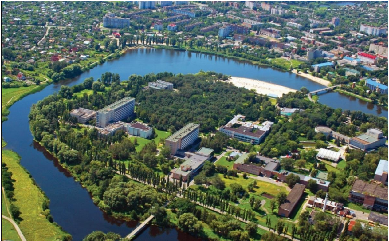
Рис. 2.1. Курорт Миргород

Ціни на номери варіюються від 990 грн за номер Економ 2-місн. до 2 094 грн за студію 1-місн. За останні роки в Миргороді також з'явилися альтернативні варіанти розміщення для туристів, такі як кемпінги та гостели (рис. 2.1). Кемпінги зазвичай знаходяться на околицях міста і пропонують можливість розміститися в палатках на природному ділянці, що дозволяє насолодитися затишком за межами міської зони. У м. Миргороді, окрім готелів та санаторіїв, є також приватні готельні комплекси, котеджі та апартаменти, які є зручними для сімейного відпочинку або для довгострокового перебування. Усі ці варіанти розміщення пропонують необхідні зручності для комфортного перебування туристів, такі як чиста постіль, щоденне прибирання, наявність кондиціонерів та опалення в номерах, супутникове телебачення, безкоштовний Wi-Fi та інші [12].