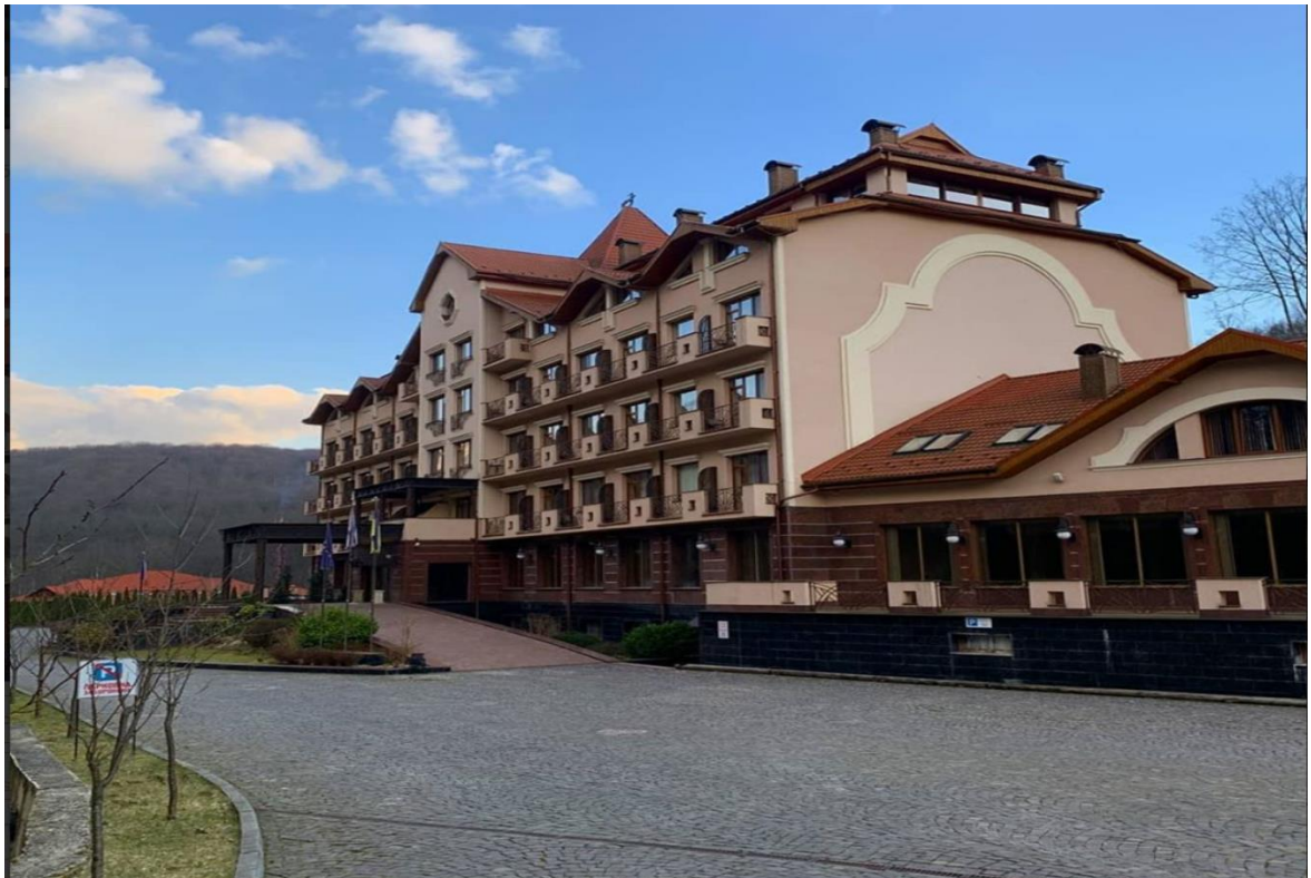
Рис 2.2. Санаторій Сольва

рухової системи, серцево-судинної системи, гінекологічних захворювань, хвороб шлунково-кишкового тракту та станів післяопераційного відновлення, санаторій Сольва надає своїм гостям доступ до сучасних медичних кабінетів та лікувальних процедур, таких як лікувальні ванни, масаж, фізіотерапія, лазеротерапія, інгаляції тощо. (рис 2.2). У санаторії наявні такі додаткові можливості, як басейн, фітнес-центр, сауна, тенісні корти, ресторани та кафе, що дозволяють гостям розважатися та відпочивати після процедур. Лікувальні послуги та медичні процедури в санаторії Сольва забезпечуються висококваліфікованими медичними працівниками, які мають багатий досвід та постійно підвищують свій професійний рівень. Крім того, комплекс має власний медичний центр з сучасним обладнанням та лікувальною базою, де надаються різноманітні медичні та лікувальні процедури.