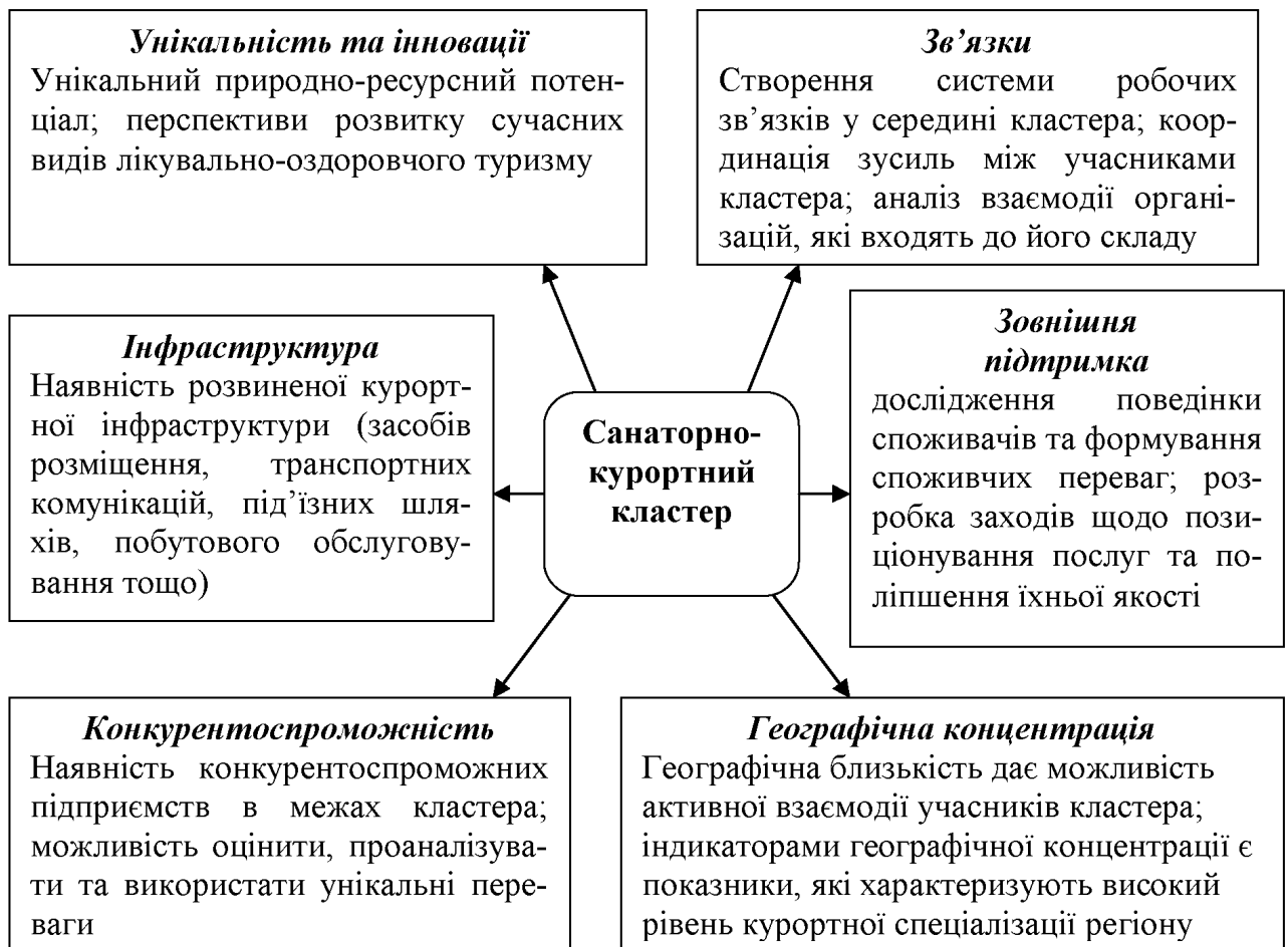
Рис. 3.1. Складові та напрями санаторно-курортного кластера Житомирщини

Важливо сформуванню стратегію розвитку курортно-рекреаційного господарства Житомирщини з такими основними чинниками: