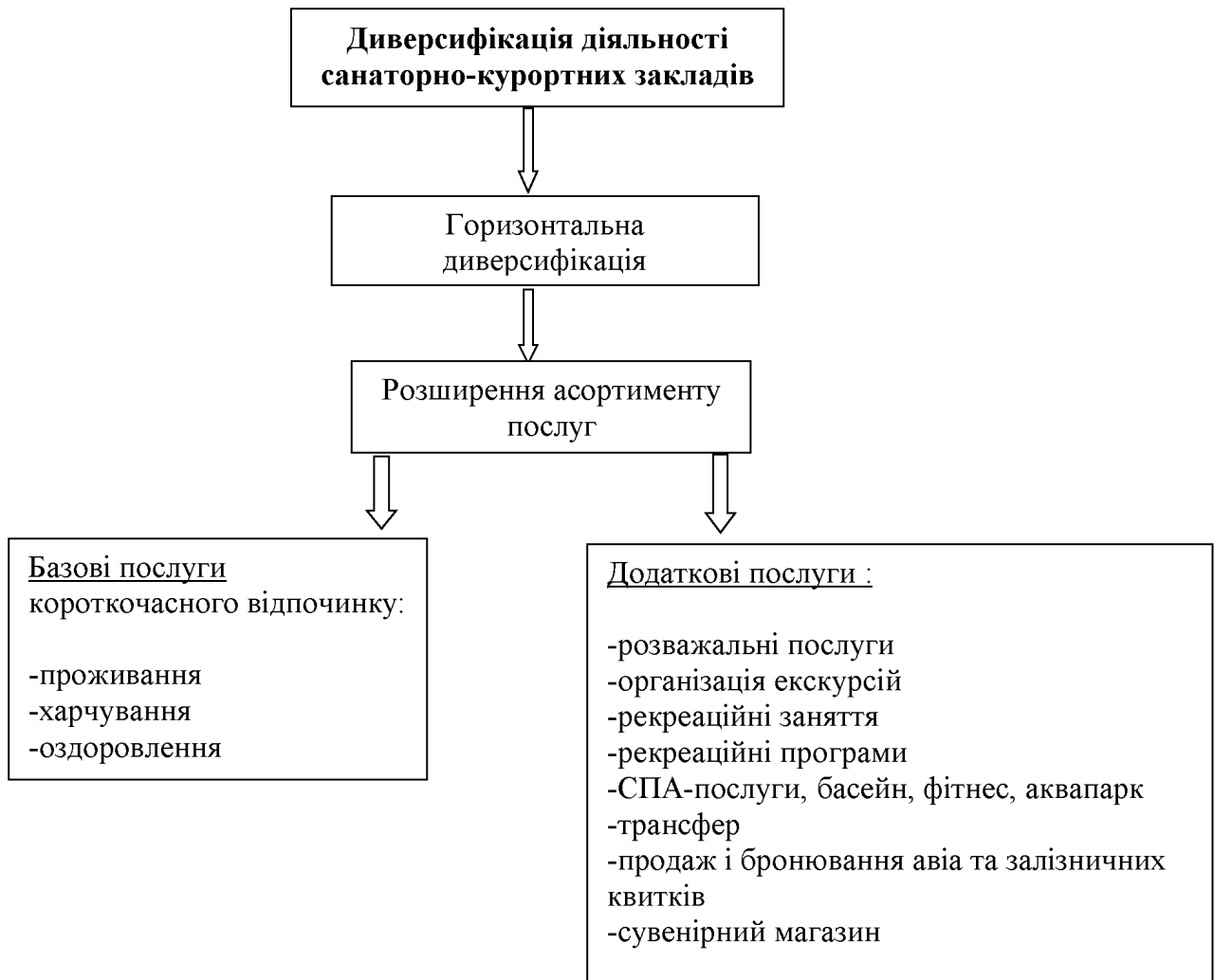
Рис. 3.2. Схема диверсифікації діяльності санаторно-курортних закладів

Інноваційна діяльність санаторно-курортних організацій України має носити комплексний характер та враховувати взаємозалежні актуальні напрямки інноваційної діяльності у санаторно-курортному господарстві. Крім того, самі інновації покликані орієнтуватися на місцеві ресурси та передумови, відрізнитися креативним підходом – на противагу поширеній тактиці копіювання успішних інновацій конкурентів.