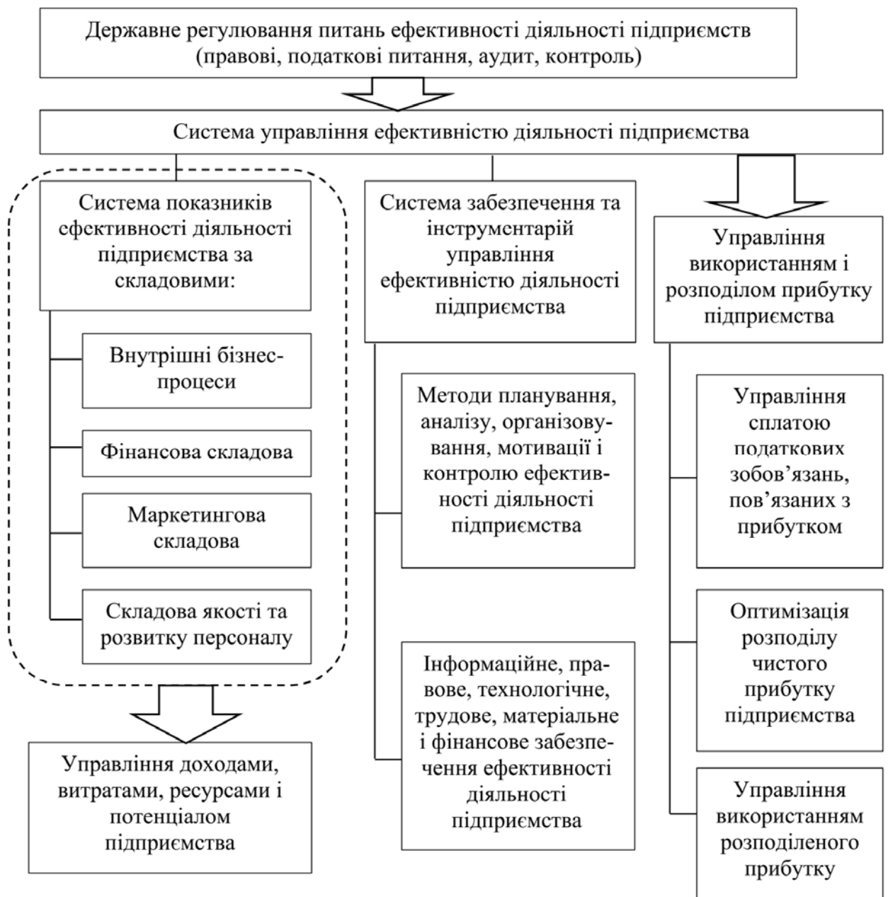
Рис. 1.1. Структура системи управління ефективністю діяльності підприємства