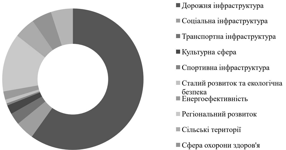
Рис. 3.1. Загально-державна підтримка соціально-економічного розвитку територій у 2022 році, млрд грн.

них майже 60 % або 62,1 млрд. грн було закладено на відновлення та будівництво транспортної інфраструктури; 13,8% – це регіональний розвиток; 5,3% - щодо розвитку освіти; 5,1 % – безпосередньо на розвиток сільських територій; 4,4% – для розвитку соціальної інфраструктури; 2,8 % – виділено на проекти, які пов'язані з транспортною інфраструктурою; 2,3 % – заклади культури; 0,9 % – вкладено в спортивну інфраструктуру і 0,9 млрд грн – виділено на реалізацію заходів, пов'язаних з екологічною безпекою [30].