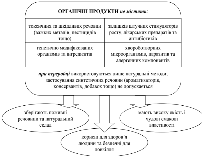
Рис. 1. Основні характеристики органічних продовольчих продуктів