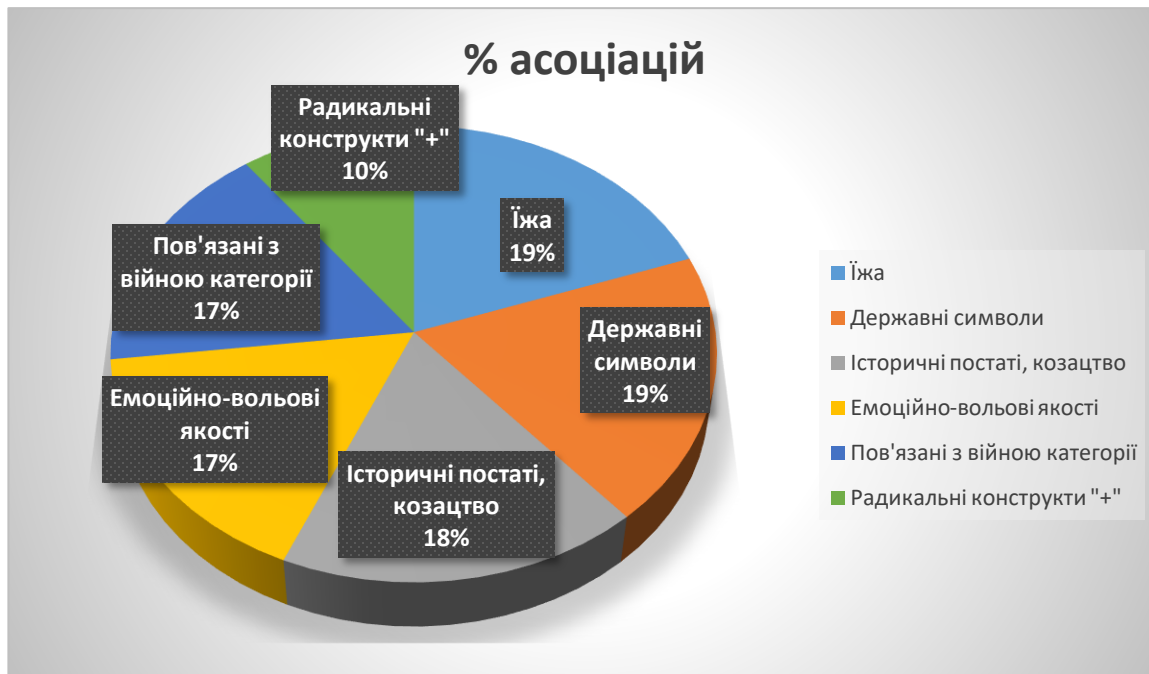
Рис. 3.3 частотний розподіл асоціацій у відповідності до категорій аналізу асоціативно-експериментального дослідження етнічної самоідентифікації.

Категорія «Їжа» займає 19% з загальної кількості асоціацій (88 асоціацій). До неї увійшли такі, найчастіше вживані асоціації, як «Борщ, сало, узвар, вареники, деруни».