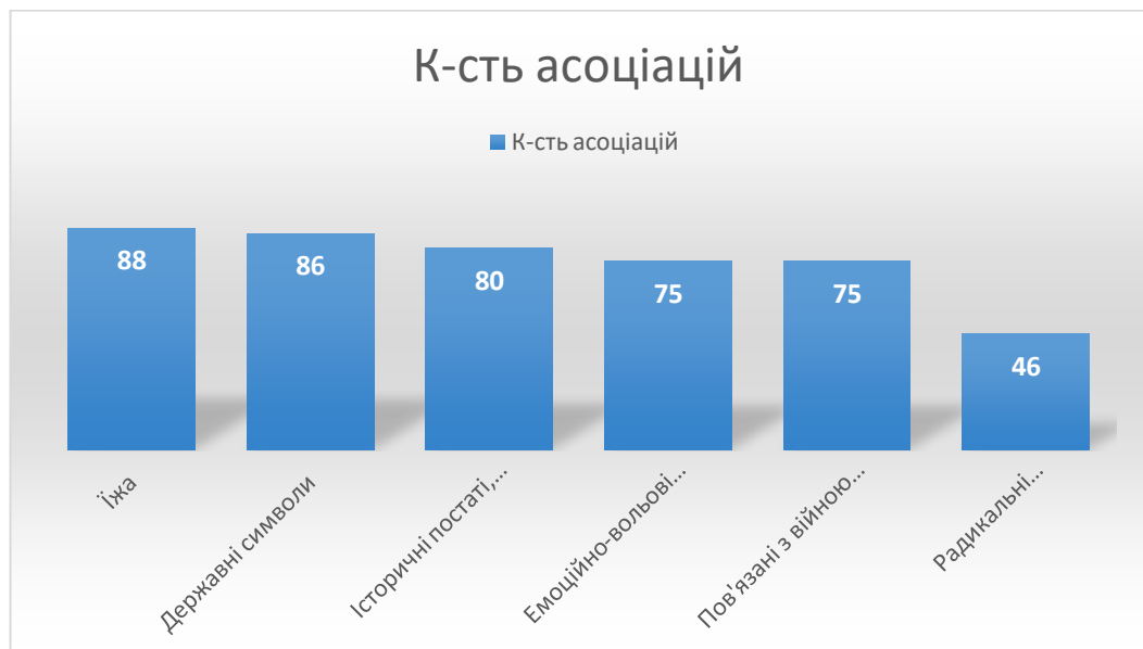
Рис. 3.2 кількісний розподіл асоціацій у відповідності до категорій аналізу асоціативно-експериментального дослідження етнічної самоідентифікації.

На основі проведення асоціативно-експериментального дослідження було виявлено 37 асоціацій, які нам вдалося класифікувати за 6-ма групами на основі спільних ознак (див. Додаток В).