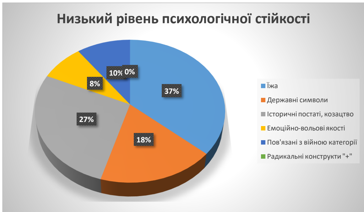
Рис. 3.8. Частотний розподіл категорій асоціацій у досліджуваних з низьким рівнем психологічної стійкості.

Таким чином в структурі етнічної самоідентифікації досліджуваних з середнім рівнем психологічної стійкості переважають ознаки помірнього рівня прояву етнічної самоідентифікації. Разом з тим наявні ознаки вираженого та радикального рівнів.