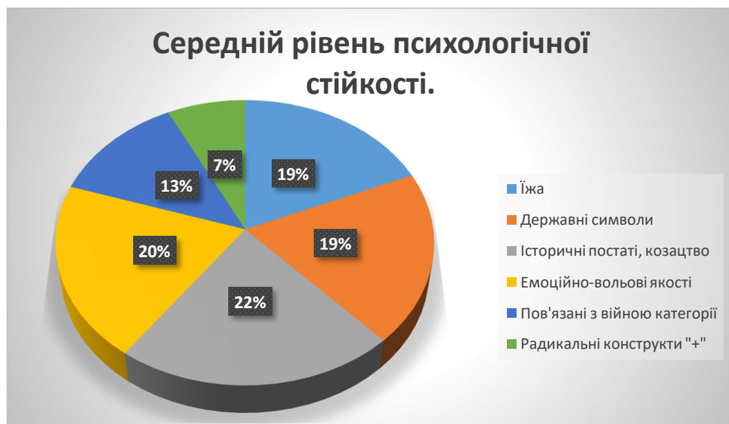
Рис. 3.7 частотний розподіл категорій асоціацій у досліджуваних з середнім рівнем психологічної стійкості.

Таким чином можна зробити висновок, що у досліджуваних з високим рівнем психологічної стійкості переважають ознаки вираженого та радикального рівнів прояву етнічної самоідентифікації.