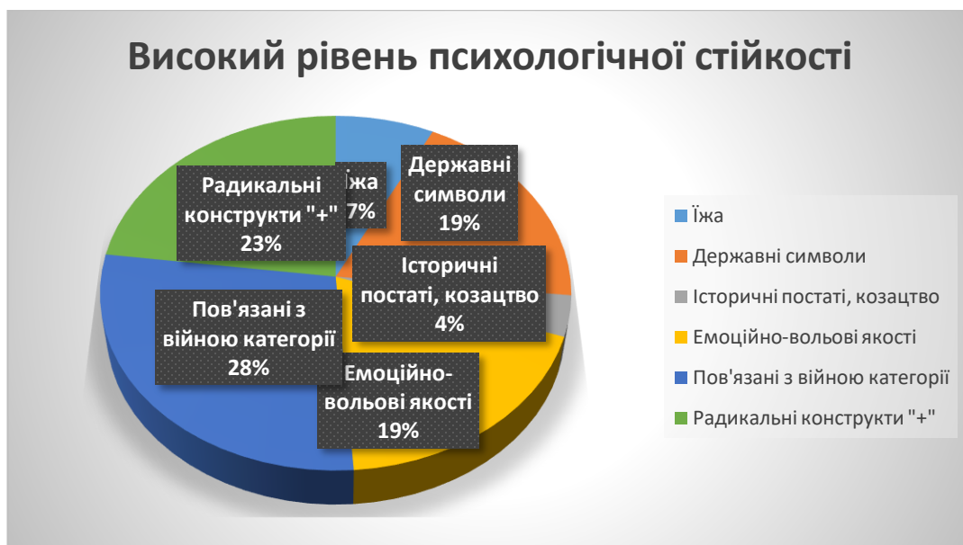
Рис. 3.6 частотний розподіл категорій асоціацій у досліджуваних з високим рівнем психологічної стійкості.

Таким чином можна зробити висновок, що у досліджуваних з високим рівнем психологічної стійкості переважають ознаки вираженого та радикального рівнів прояву етнічної самоідентифікації.