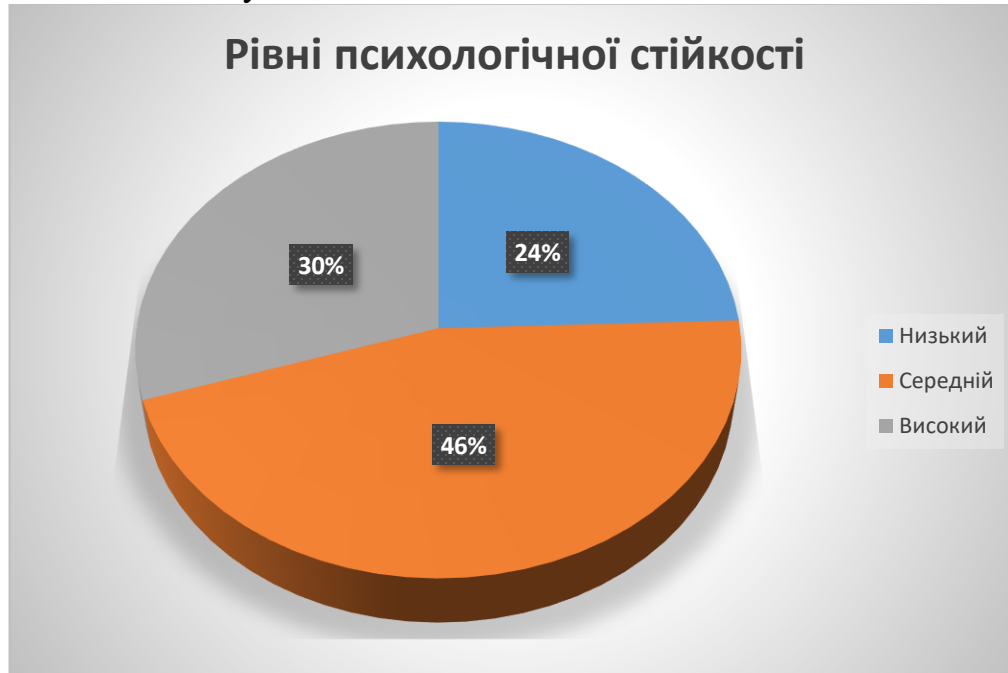
Рис. 3.1. Часткове співвідношення рівнів психологічної стійкості особистості українців в умовах війни.

В дослідженні взяли участь 90 осіб чоловічої статі віком від 25 до 45 років.