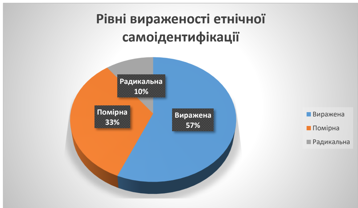
Рис. 3.4 частотний розподіл рівнів вираженості етнічної самоідентифікації.

На основі категоризації даних нам вдалося виділити 3 рівні вираженості етнічної самоідентифікації, в саме виражену, помірну та радикальну самоідентифікацію.