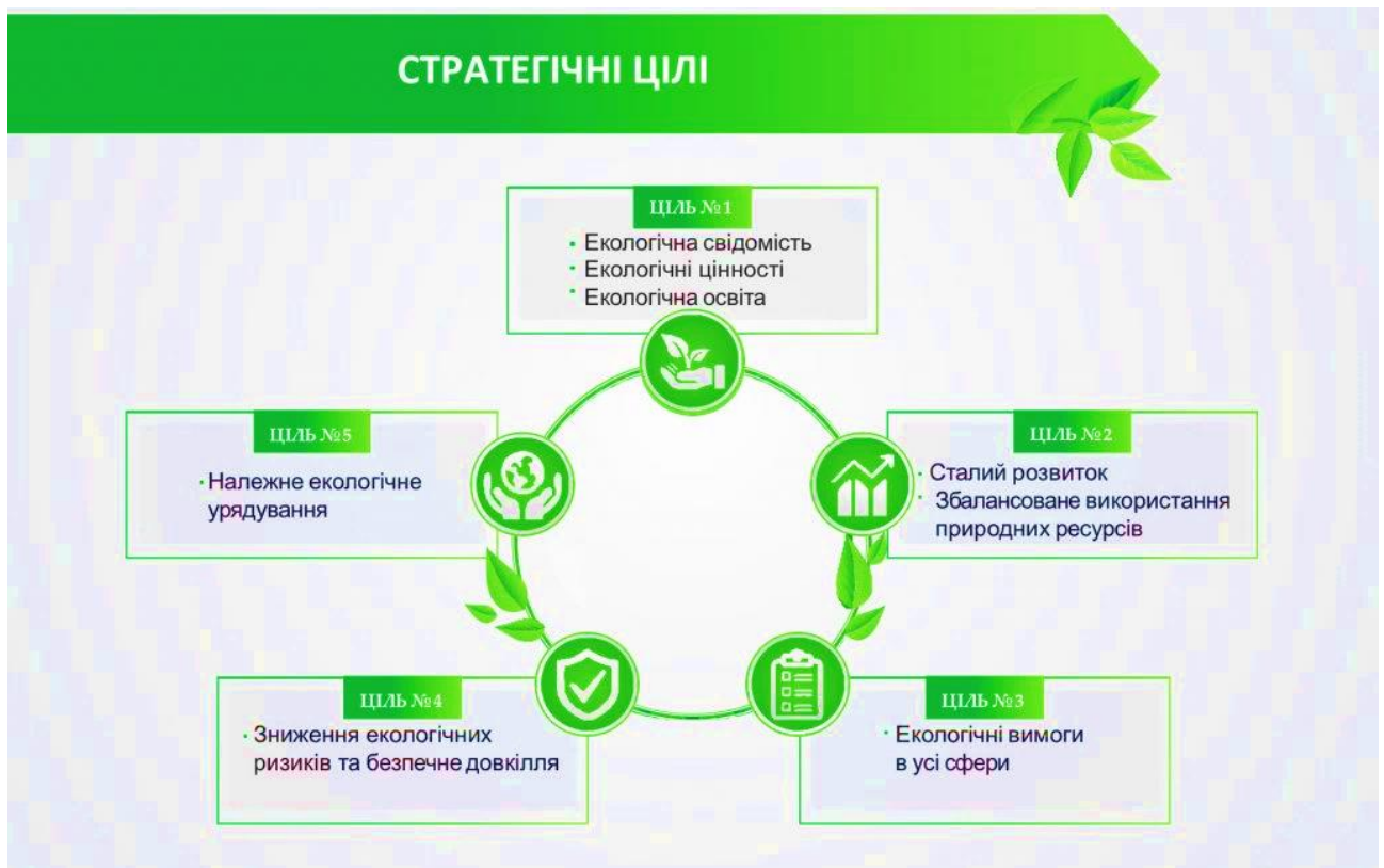
Рис. 1.1. Стратегічні цілі Національної екологічної політики

Національна екологічна політика є надзвичайно важливою галуззю державної діяльності, орієнтованою на забезпечення права кожного громадянина на життя в здоровому та безпечному довкіллі. Ця політика спрямована на збереження природних ресурсів, запобігання забрудненню навколишнього середовища і відшкодування можливих шкідливих впливів (рис. 1.1-1.2).