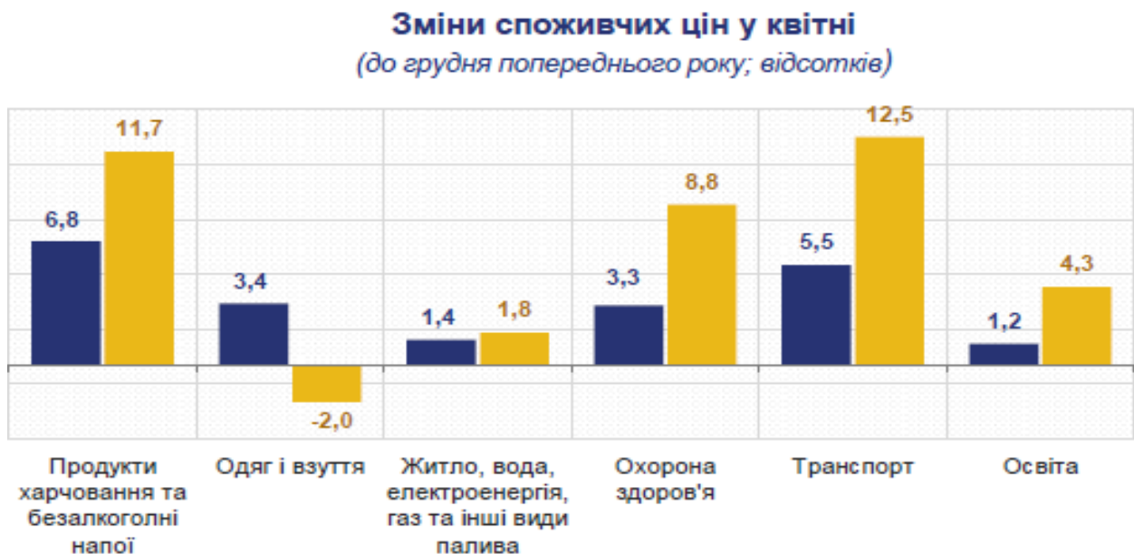
Рис. 2.2. Динаміка споживчих цін у квітні 2022р. в порівнянні з груднем 2021 р. щодо продуктів харчування та послуг в Житомирському регіоні в %

Рис. 2.2 ілюструє зміни цін у квітні 2022 року в порівнянні із груднем 2021 року на продукти харчування і послуги в Житомирській області.