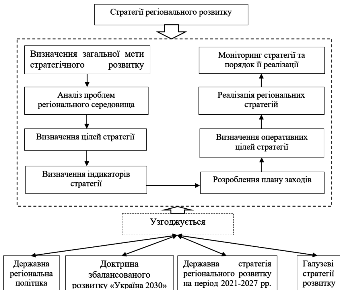
Рис. 1.4. Будова циклу формування і реалізації регіональної стратегії

для регіонів були визначені у «Державній стратегії регіонального розвитку на 2021-2027 роки та план дій щодо її реалізації». Опрацювання положень Стратегії соціально-економічного розвитку Житомирської області висвітлено в «Стратегії регіонального розвитку Житомирської області на період до 2027 року». На рис. 1.1 представлений цикл формування, написання та подальшої реалізації регіональних стратегій [37].