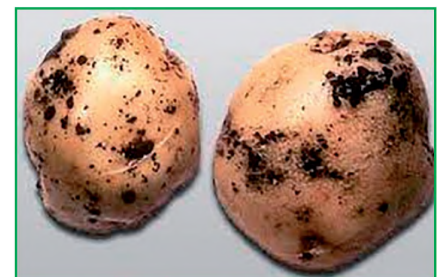
Рис. 1. Зовнішні ознаки ураження бульб картоплі збудником гриба Rhizoctonia solani Kuhn (сорт Пролісок)

Останні офіційні видання з описом сортів картоплі містять відомості щодо їхньої стійкості проти багатьох хвороб, зокрема стеблової нематоди, фітофторозу, парші звичайної, альтернاریозу, однак стосовно ризоктоніозу така інформація відсутня. Основні узагальнені праці щодо ризоктоніозу картоплі не містять оцінювання стійкості проти цієї хвороби