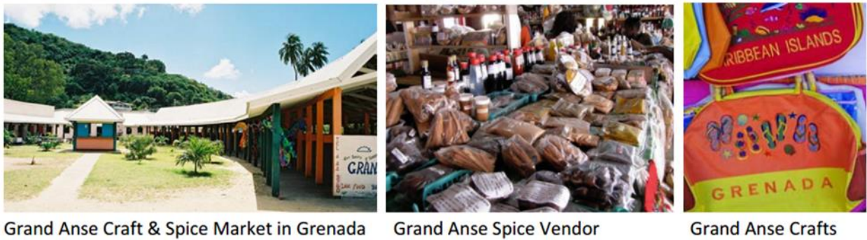
Рис. 3. Практичний приклад ППП: