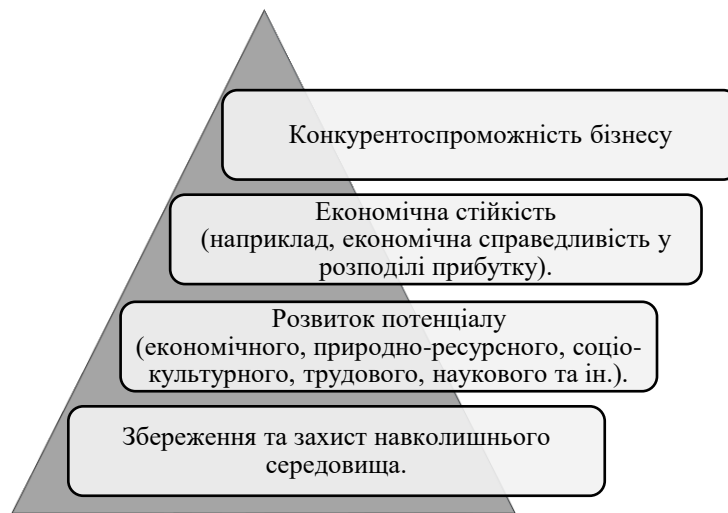
Рис. 3.2. Завдання ППП в забезпеченні сталості розвитку туризму

Таким чином, аналізуючи завдання наведених у 2 розділі кваліфікаційної роботи проектів ППП в сфері туризму, об'єднаємо їх цілі в 4 групи (рис. 3.2).