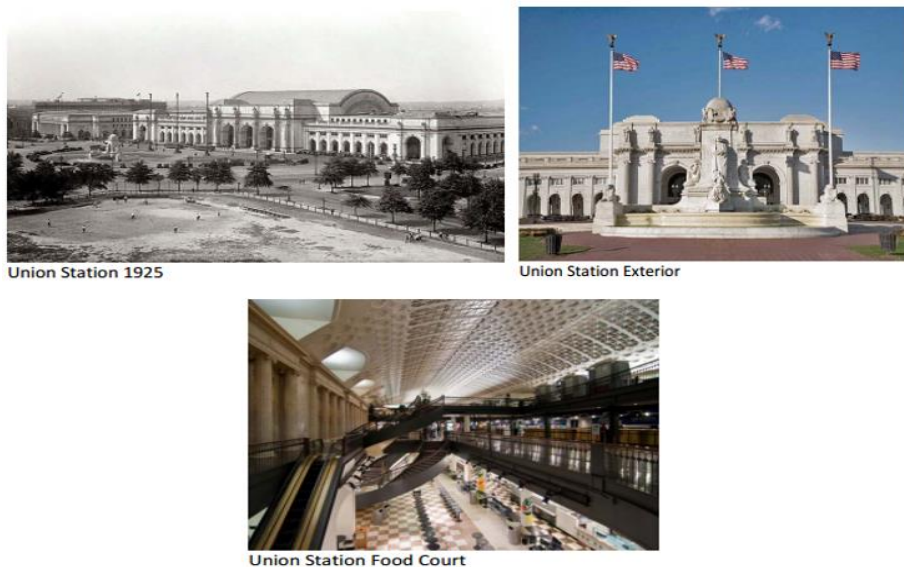
Рис. 2.1. Практичний приклад ППП: Реконструкція історичної пам'ятки – залізничного вокзалу у Вашингтоні (США)

Відмітимо, що сьогодні у світі реалізуються сотні проєктів ППП у сфері туризму. Наприклад, такі проєкти в США, Канаді, ЄС, Бразилії, Індії, Китаї, Таїланді, Австралії, Непалі, країнах Карибського басейну, Гані направлені на зростання ролі туризму в країні в цілому. На державному рівні дані країни визнають важливість туризму як форми розвитку національної економіки [5]. Це означає, що публічна влада надає пріоритет розвитку туризму, приймає закони, розробляє стратегії, наймає радників з питань розвитку туризму на умовах публічно-приватного партнерства. Крім того, держави використовують механізм ППП і в інших сферах, таких як: сільське господарство, транспорт, освіта та наука, оскільки туризм тісно взаємодіє з різними галузями економіки. Це вимагає співпраці між різними урядовими та неурядовими організаціями, включаючи і приватний сектор. Наприклад, залізничний вокзал у Вашингтоні (США, округ Колумбія) (рис. 2.1) [8].