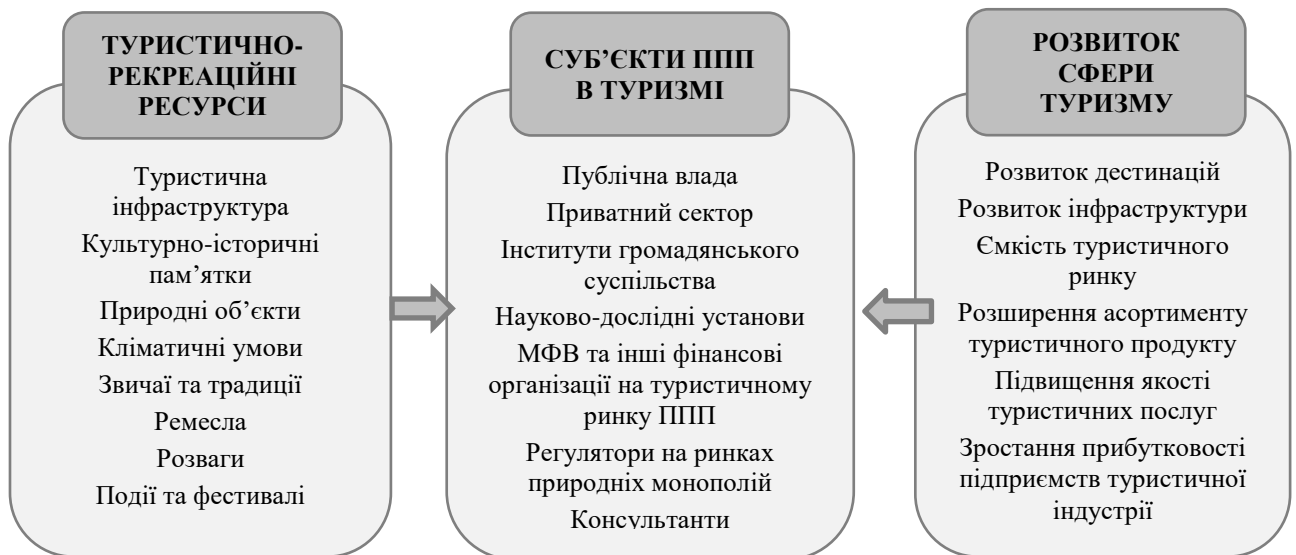
Рис. 1.4. Концептуальна модель ППП в туризмі