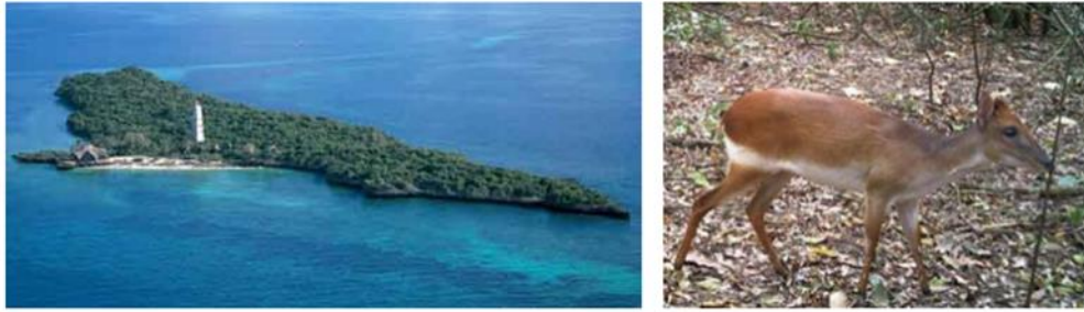
Рис. 2.2. Практичний приклад ППП: Екотуризм острова Чамбе (Танзанія)

Наприклад, ППП екотуризму острова Чамбе, Танзанія (рис. 2.2) [8].