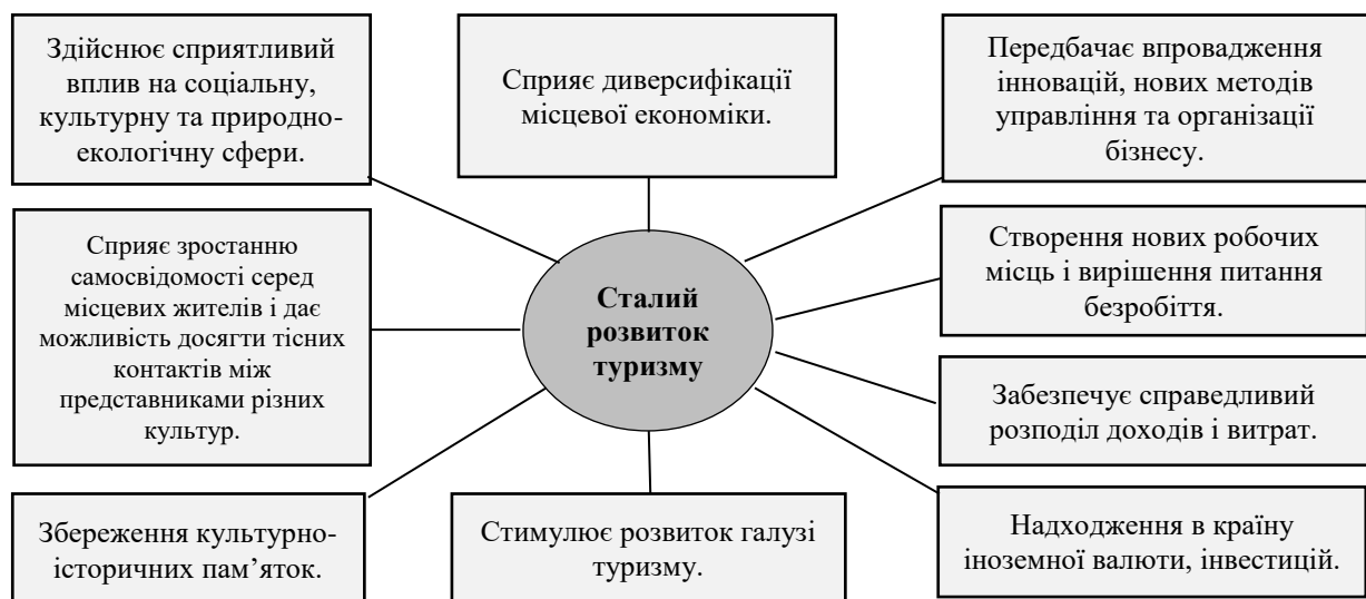
Рис. 3.3. Вплив ППП на забезпечення сталого розвитку туризму

Вплив публічно-приватного партнерства на забезпечення сталого розвитку туризму представлено на рис. 3.3.