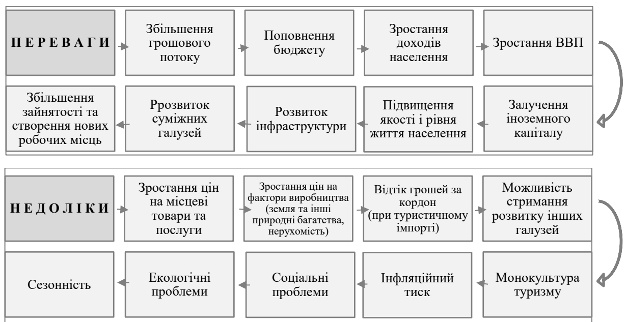
Рис. 1.1. Переваги та недоліки розвитку туризму

Також туризм може породжувати інфляцію. Так, туристи витрачають в місті подорожування свої гроші, підвищуючи цим самим доходи регіону, що не виключає інфляційного тиску. Зростають ціни на продукти харчування, одяг, транспорт, житло. Як свідчить досвід, у туристичних регіонах особливо стрімко дорожчає земля. Ціна, яку іноземні туристи готові заплатити за своє проживання під час відпустки, може стрімко знизити попит місцевих жителів на житло, які будуть витіснені з ринку житла в районах з розвинутою туріндустрією [21]. Нами систематизовано переваги та недоліки розвитку туризму (рис. 1.1).