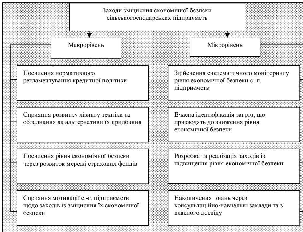
Рис. 2. Заходи зміцнення економічної безпеки сільськогосподарських підприємств на різних рівнях ієрархії