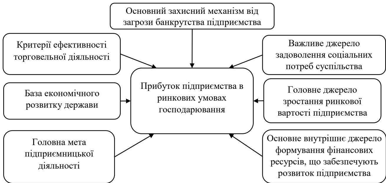
Рис. 1.1. Характеристика ролі прибутку підприємства в умовах ринкової економіки

насамперед, розвиває ринкову економіку, тому існує певна характеристика ролі прибутку підприємства, яка висвітлена М.М. Павлишенко [28] (рис. 1.1):