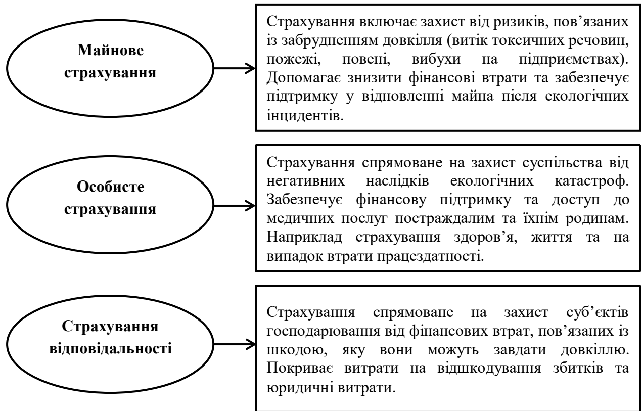
Рис. 3.2. Основні напрями розвитку екологічного страхування

третіх осіб, екологічне страхування може покривати судові витрати та можливі штрафи, що сприяє захисту фінансових інтересів суб'єктів страхування.