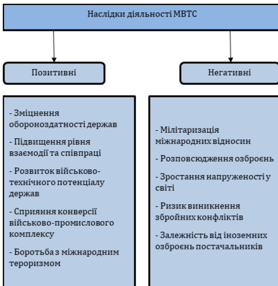
Рис. 1.2. Позитивні та негативні наслідки МВТС

Міжнародне військово-технічне співробітництво (МВТС) є важливою складовою сучасних міжнародних відносин, що має суттєвий вплив на безпеку та стабільність у світі. Як і будь-яке співробітництво, МВТС може мати як позитивні, так і негативні наслідки, і розуміння цих аспектів є критично важливим для формування збалансованої міжнародної політики (рис. 1.2).