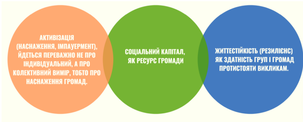
Рис. 2.2. Основні складові соціального розвитку громад

Разом з тим, можна виділити основні складові соціального розвитку громад, які показано на рис. 2.2.