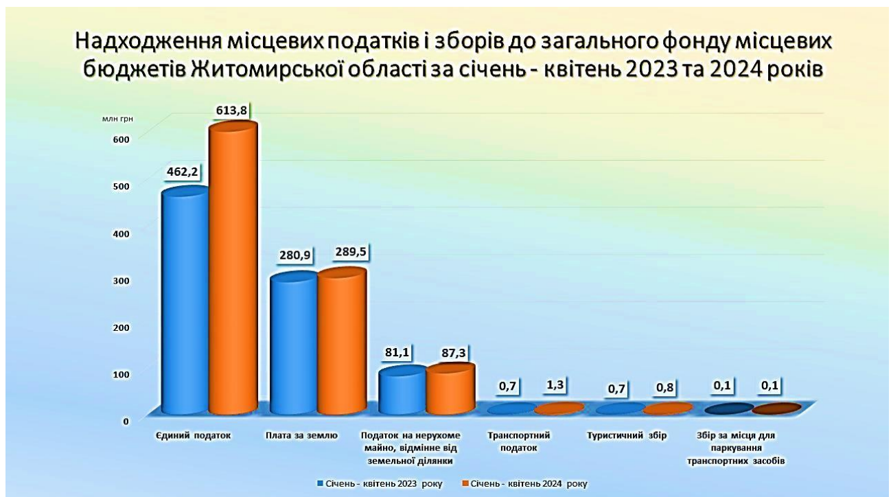
Рис. 2.4. Надходження місцевих податків до місцевих бюджетів Житомирської області

Сільське господарство традиційно є важливою галуззю для Житомирської області, виробництво зернових культур залишилося на стабільному рівні, незважаючи на труднощі з логістикою та зовнішніми ринками. Молочне виробництво теж залишалося стабільним з тенденцією до невеликого зростання, завдяки місцевим ринкам та підтримці держави. Транспортна галузь отримала значну підтримку для ремонту та розвитку інфраструктури, на ремонт доріг були виділені значні кошти, що покращило транспортну доступність і зменшило витрати на логістику. Внутрішня торгівля відновилася після спаду, пов'язаного з війною, завдяки стабілізації економічної ситуації та збільшенню купівельної спроможності населення, це збільшило надходження місцевих податків, рис. 2.4 [37].