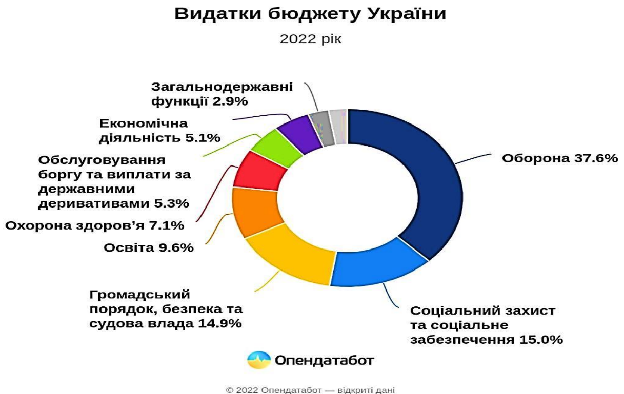
Рис. 2.1. Видатки державного бюджету України

Аналіз механізмів реалізації економічної політики держави в умовах воєнної агресії є комплексним процесом, який включає в себе розгляд різних аспектів управління економікою під час воєнного стану і з перспективою повоєнного відновлення. Відбулось суттєве збільшення державних витрат на оборону та безпеку, введено пряме фінансування армії, техніки, медицини для військових та евакуаційних заходів. Перерозподіл бюджету в 2022 році (рис. 2.1) дозволив провести скорочення неважливих витрат та перенаправити кошти на критичні для виживання галузі. Уряд провів значну роботу по залученню зовнішньої допомоги, по збільшенню фінансової та матеріальної підтримки від міжнародних організацій та партнерів [34].