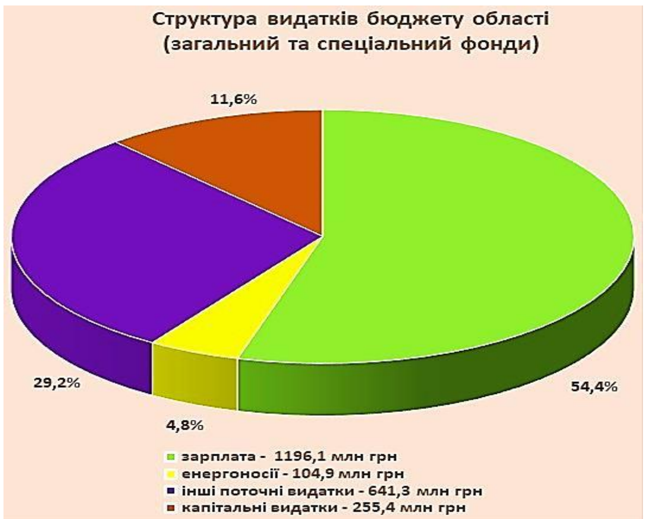
Рис. 2.5. Структура видатків бюджету Житомирської області