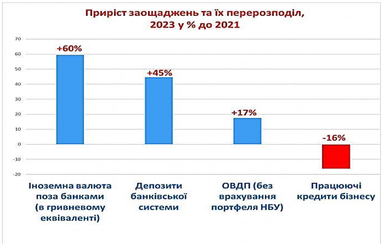
Рис. 2.2. Приріст заощаджень у 2023 році