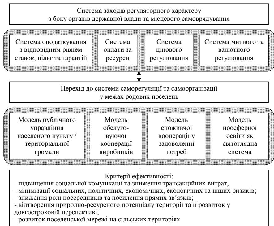
Рис. 3. Система формування підприємницького потенціалу України

стими помислами (високо свідомого та соціально-екологічно відповідального підприємництва). Наразі такі спільноти нагадують автомобілі початку ХХ ст., однак, подальший їх розвиток доводить спроможність та незалежність від природних монополій, здатність забезпечувати себе всім необхідним та продукувати додаткову цінність. Має місце відродження родючості