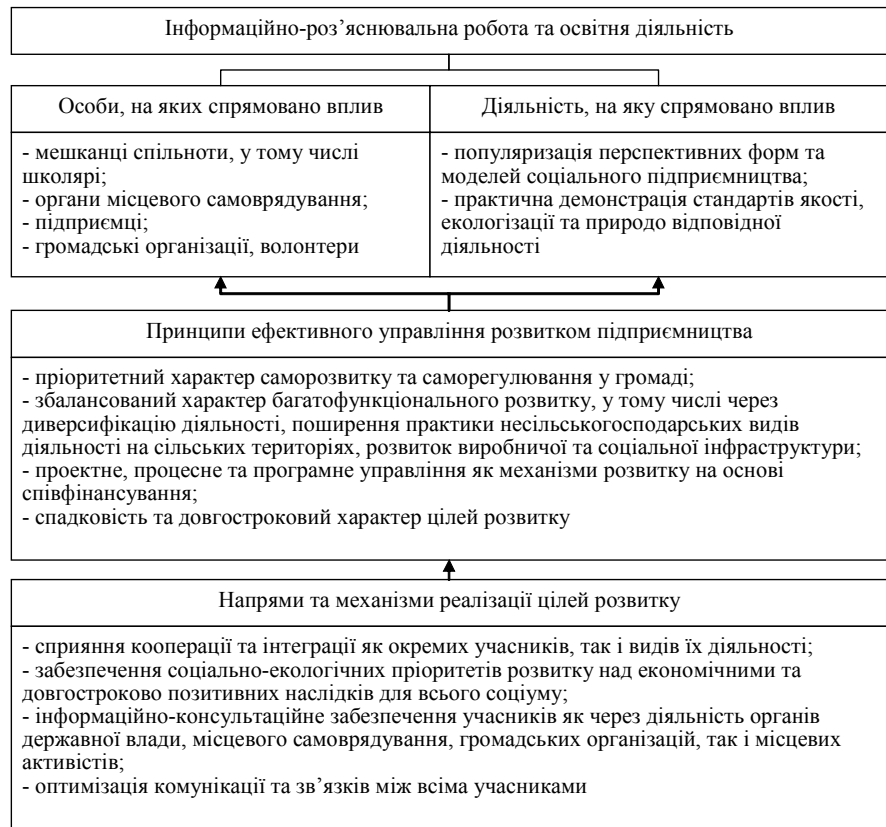
Рис. 2. Просвітницька та консультаційно діяльність на території

Позитивні наслідки цього впровадження наразі демонструють понад 100 поселень України, організовані таким чином поселення. Лише у Житомирській області їх на різній стадії становлення налічується 12. Іншими словами, такі інвестиції у сільську місцевість змінюють зовнішні умови їх функціонування, включаючи ринки, землю, капітал, технології, через зміну свідомості людини впливають на можливість інвестування та його наслідки. І на противагу суто ринковим механізмам (привабливості сільської інфраструктури, сприятливих кліматичних і погодних умов, родючих ґрунтів, недорогої та високоякісної робочої сили, сусідству таких ринків як Європейський, Африканський та Близького Сходу), на перше місце виступає розвиток духовності, культури, етики та моралі, які спричиняють відповідний вплив на індивіда та його вчинки визначають примноження та розвиток всіх раніше перелічених чинників, а також покращення життєвих ситуацій відповідно до законів еволюції, що стає запорукою підвищення добробуту, якості життя та підґрунтям до якісного нового формату бізнесу — підприємництво з чи-