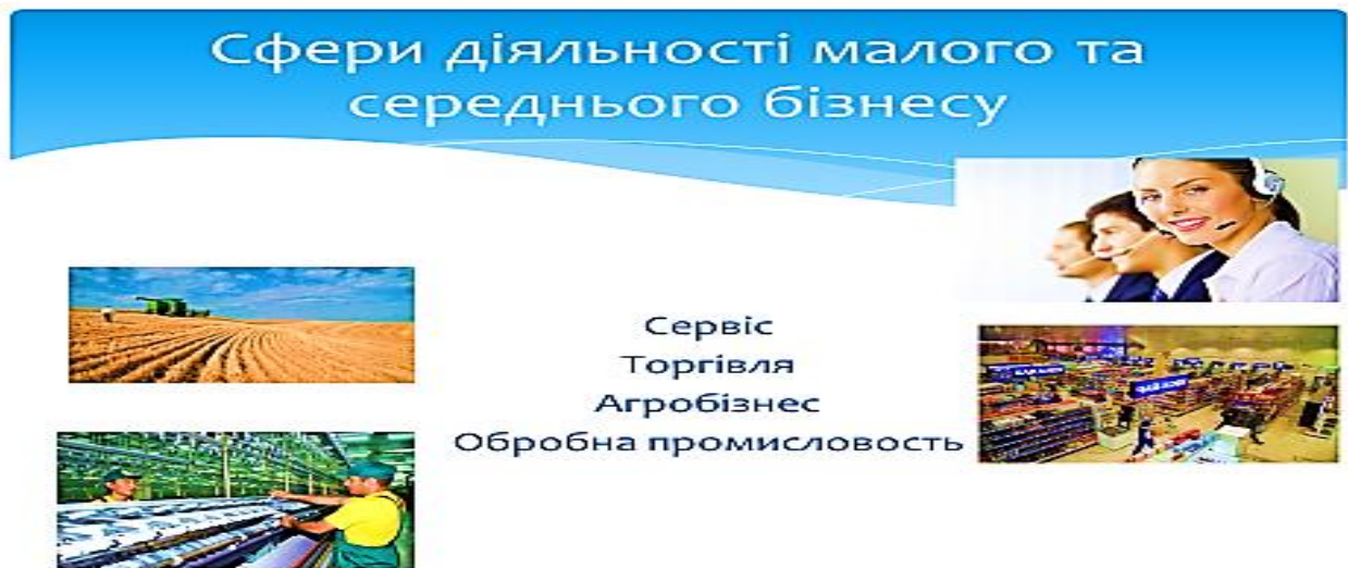
Рис. 2.1. Основні сфери діяльності підприємництва в територіальних громадах України

сталого розвитку (ЦСР), запобігаючи погіршенню стану довкілля. З іншого боку, порядок денний сталого розвитку, також може впливати на підприємництво, збалансовуючи економічні, соціальні, людські та екологічні цілі. Отже, українське підприємництво в стані війни, працює у складному, взаємозалежному середовищі, забезпечуючи сервіс, торгівлю, продовольчу безпеку і підтримуючи обороноздатність територіальних громад, рис. 2.1 [24].